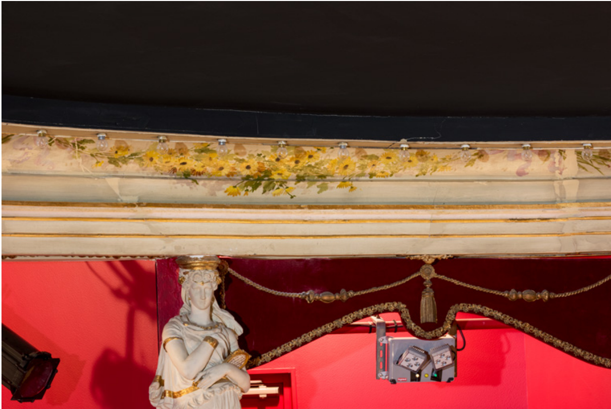
Corniche : décor de guirlande.

58, Nevers, 8 place des Reines de Pologne