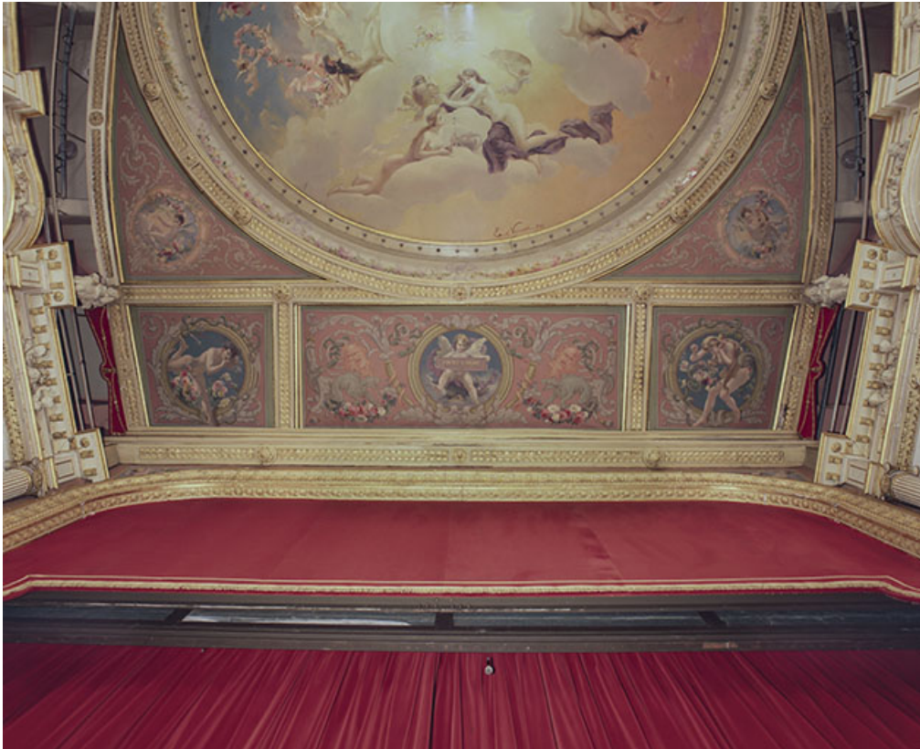
Vue d'ensemble des écoinçons et du registre intermédiaire, en 1996.

58, Nevers, 8 place des Reines de Pologne