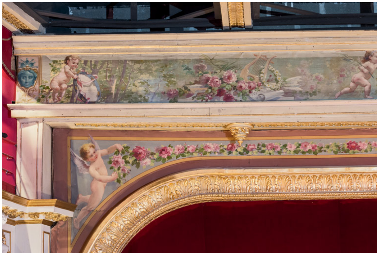
Frises : partie gauche.

58, Nevers, 8 place des Reines de Pologne