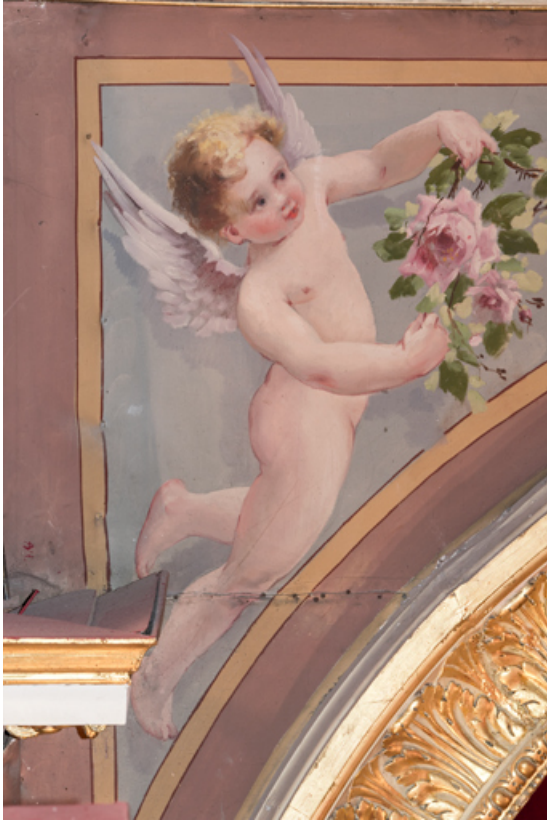
Frise du cadre de scène, partie droite : angelot.

58, Nevers, 8 place des Reines de Pologne