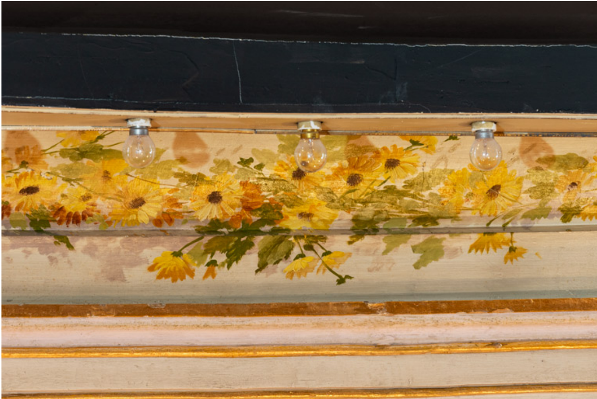
Corniche : décor de guirlande (vue rapprochée).

58, Nevers, 8 place des Reines de Pologne