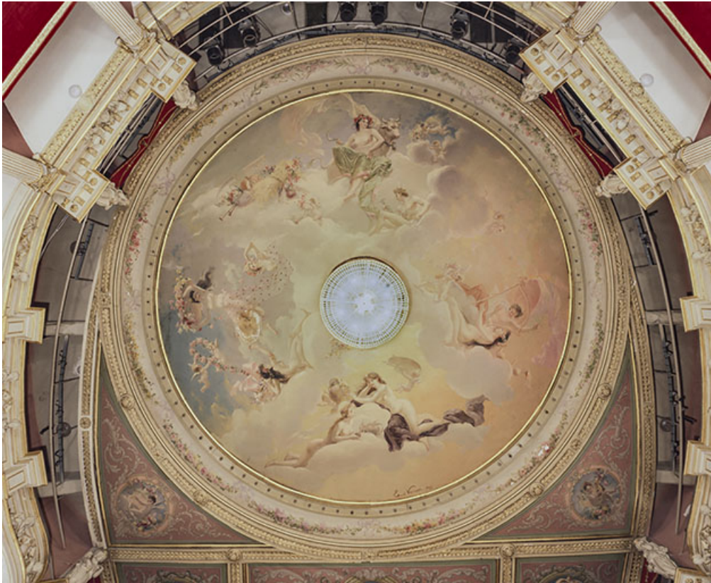
Salle : plafond, en 1996.

58, Nevers, 8 place des Reines de Pologne