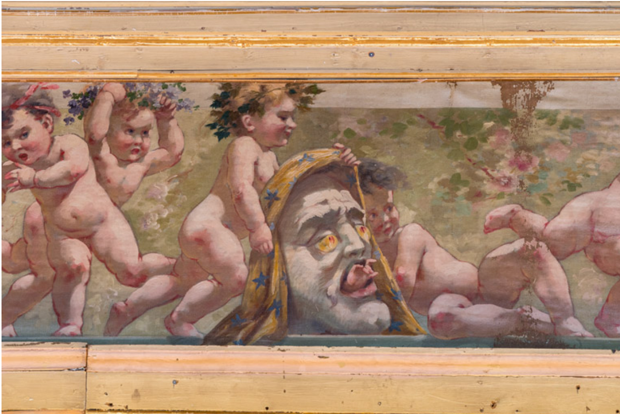
Frise supérieure, partie centrale : enfants et masque.

58, Nevers, 8 place des Reines de Pologne