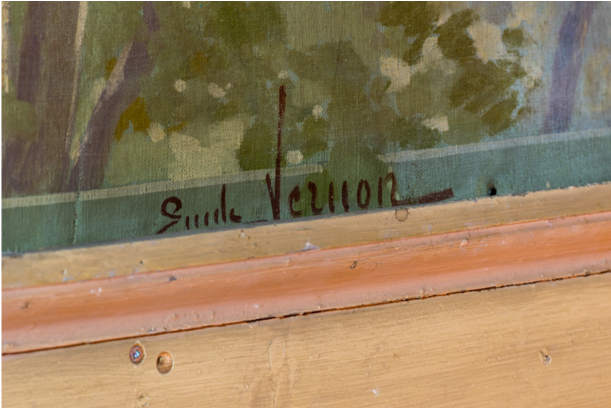
Frise supérieure : signature d'Emile Vernon.

58, Nevers, 8 place des Reines de Pologne