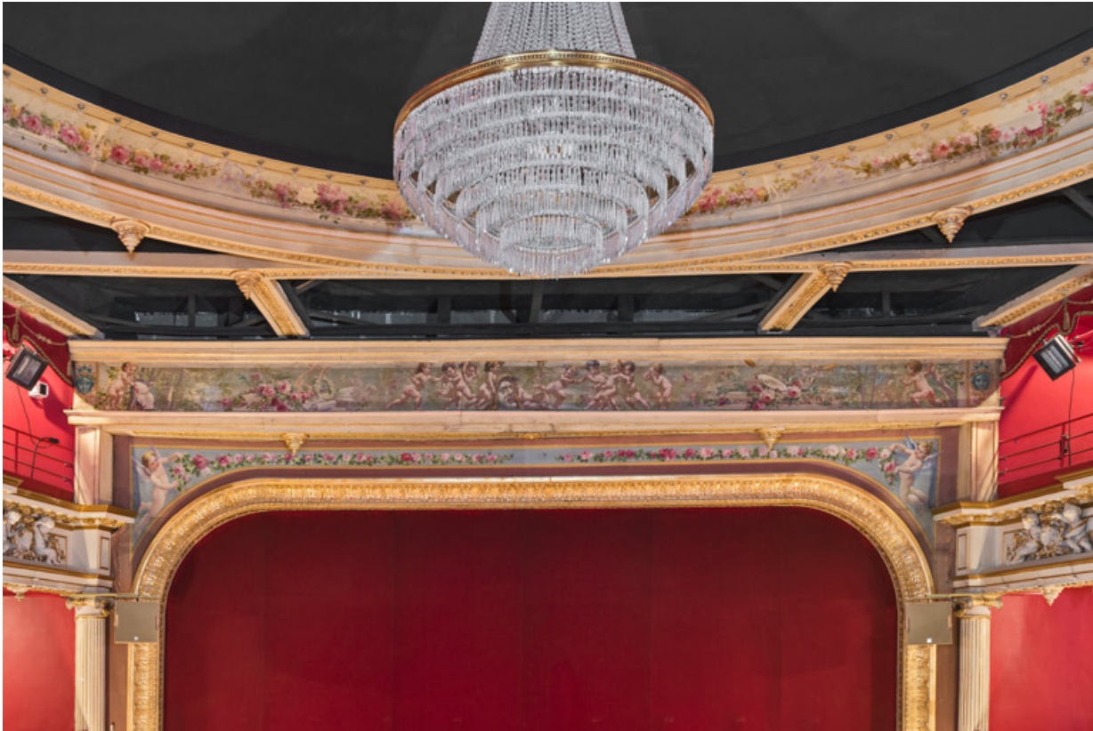
Salle : décor peint de la corniche du plafond et du cadre de scène.

58, Nevers, 8 place des Reines de Pologne