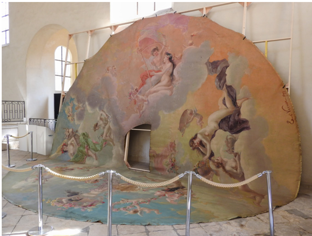
[Le tondo déposé]. S.d. [2e semestre 2017]. 58, Nevers, 8 place des Reines de Pologne