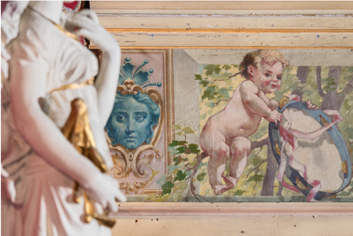
Frise supérieure : masque et enfant jouant avec un tambourin.

58, Nevers, 8 place des Reines de Pologne