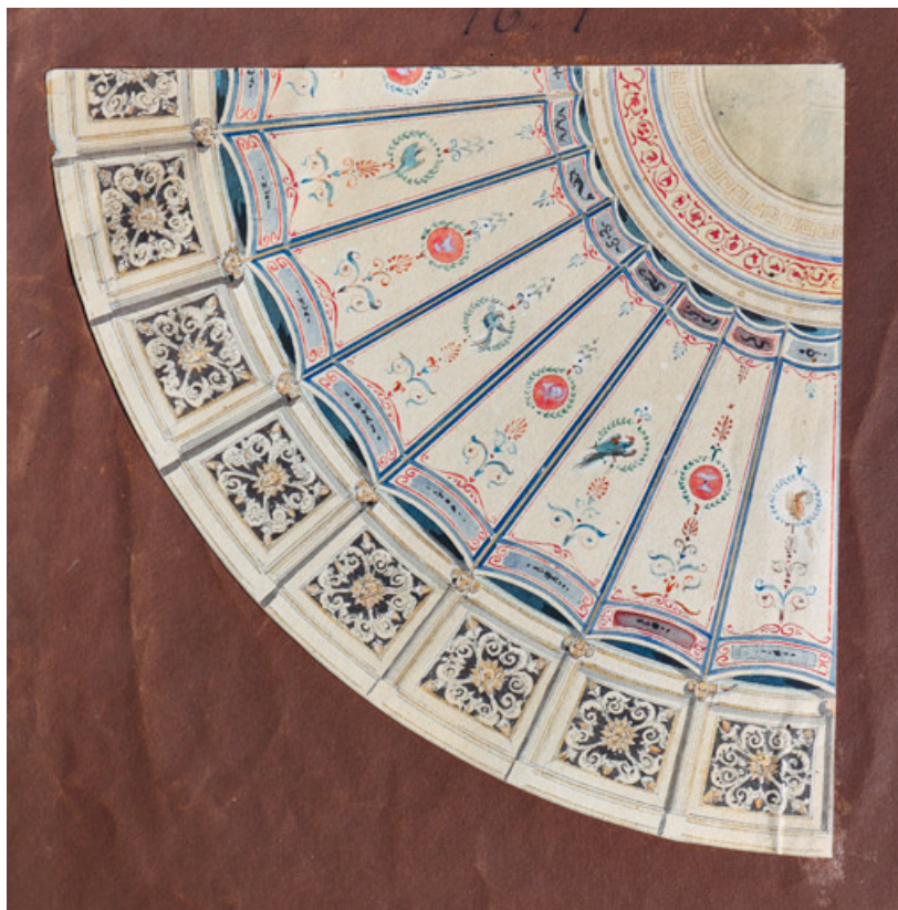
Théâtre de Dole. Etudes de plafonds. N° 1. S.d. [vers 1841].