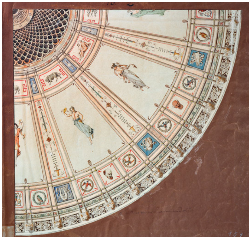
Théâtre de Dole. Etudes de plafonds. N° 2. S.d. [vers 1841].