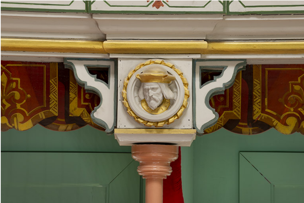
Salle : décor d'un culot du 2e balcon : 2e tête d'homme.