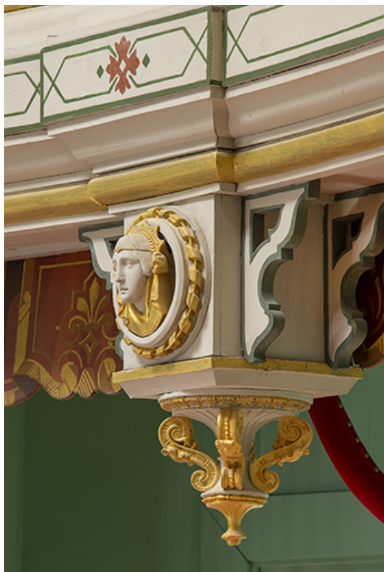
Salle : décor d'un culot du 2e balcon : 2e tête de femme (vue de trois quarts). 39, Dole, 30 rue du Mont-Roland