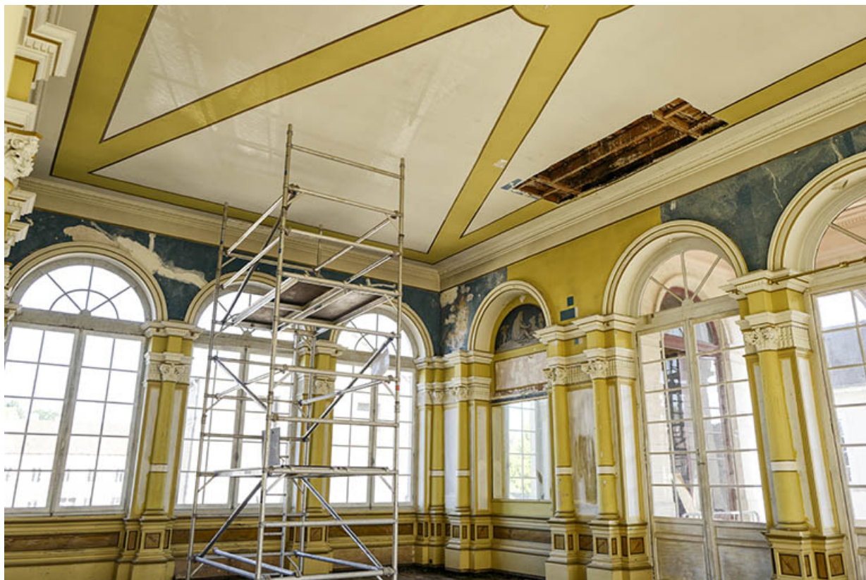
Foyer en cours de restauration, en 2020.