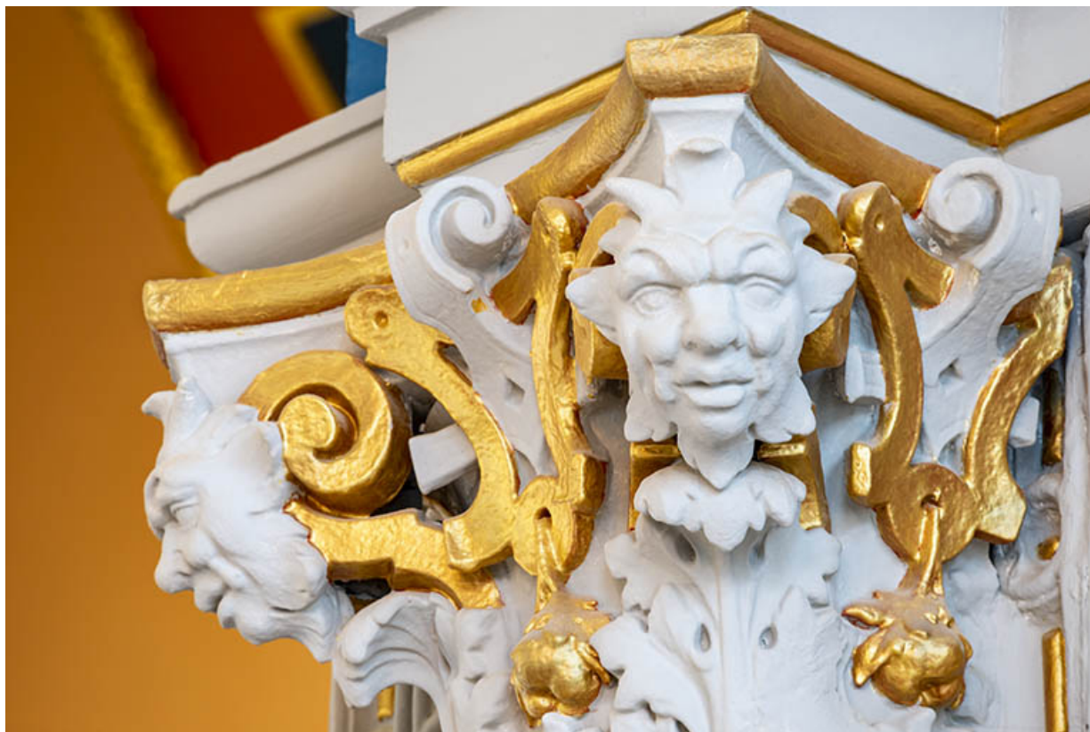
Foyer : détail d'un chapiteau et des masques.