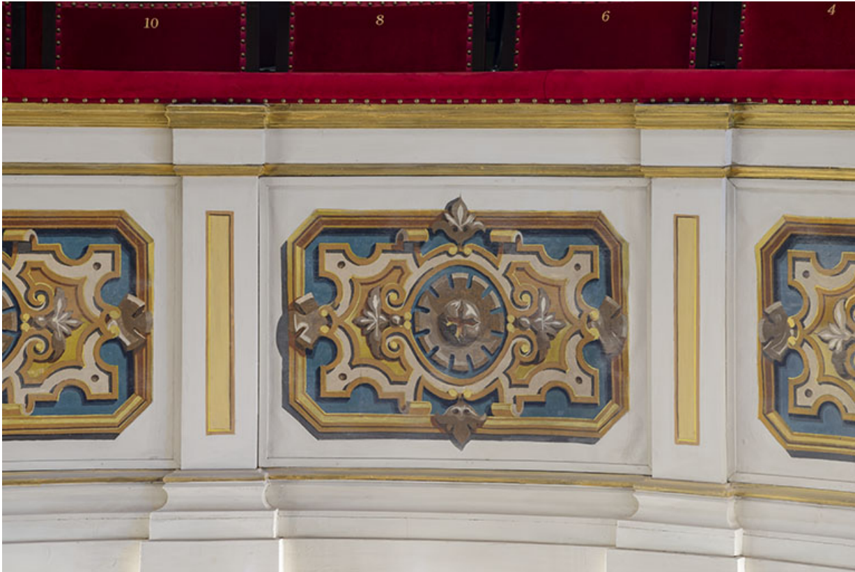
Salle : décor du garde-corps du 1er balcon.