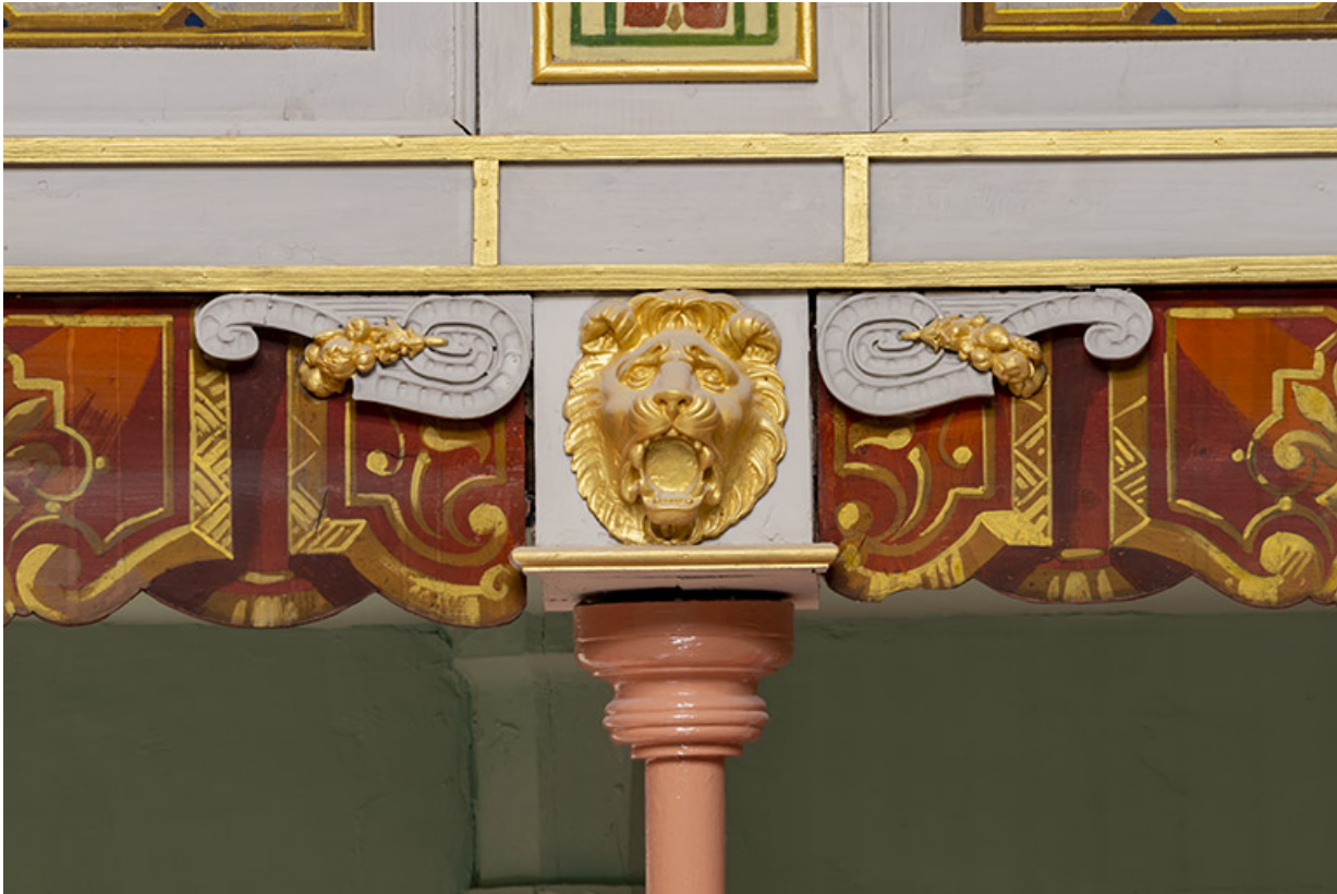
Salle : décor d'un culot du 3e balcon : mufle de lion.