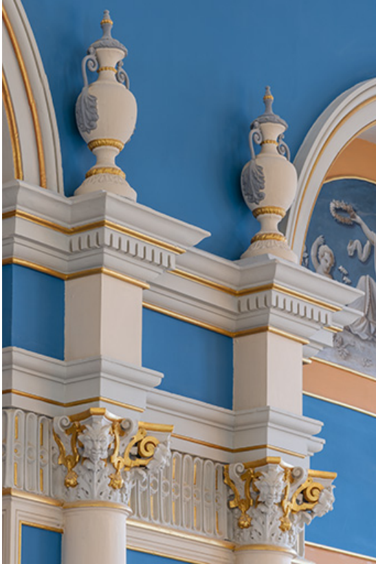
Foyer : chapiteaux, entablement et vases.