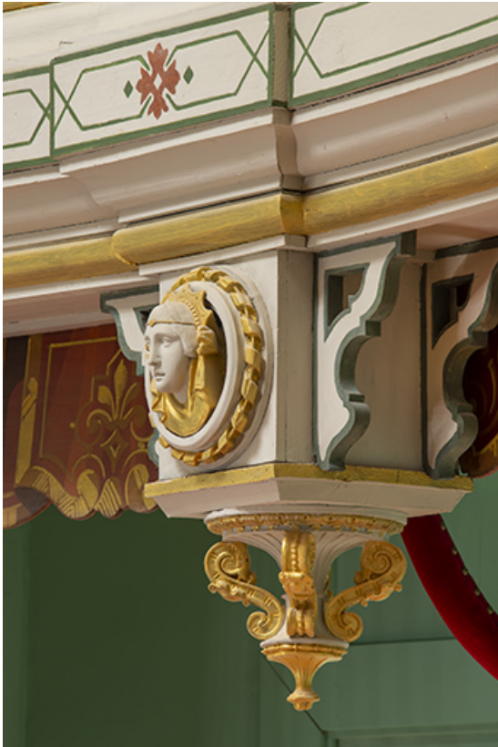
Salle : décor d'un culot du 2e balcon : 2e tête de femme (vue de trois quarts). 39, Dole, 30 rue du Mont-Roland