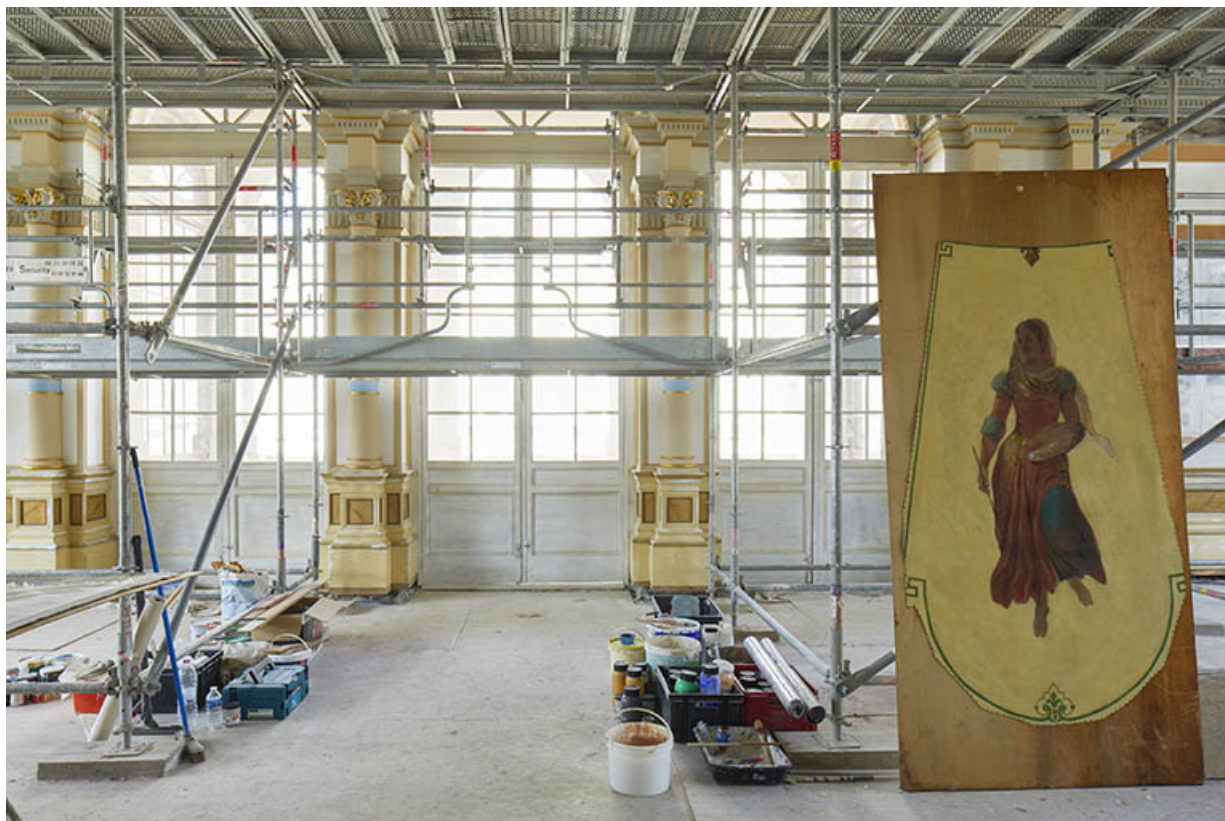
Allégorie de la peinture, déposée dans le foyer en cours de restauration, en 2020. 39, Dole, 30 rue du Mont-Roland