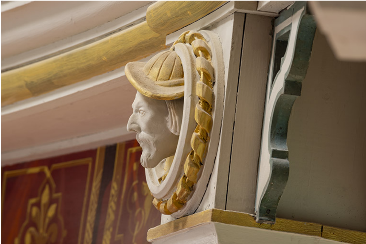
Salle : décor d'un culot du 2e balcon : 1re tête d'homme (vue de profil). 39, Dole, 30 rue du Mont-Roland