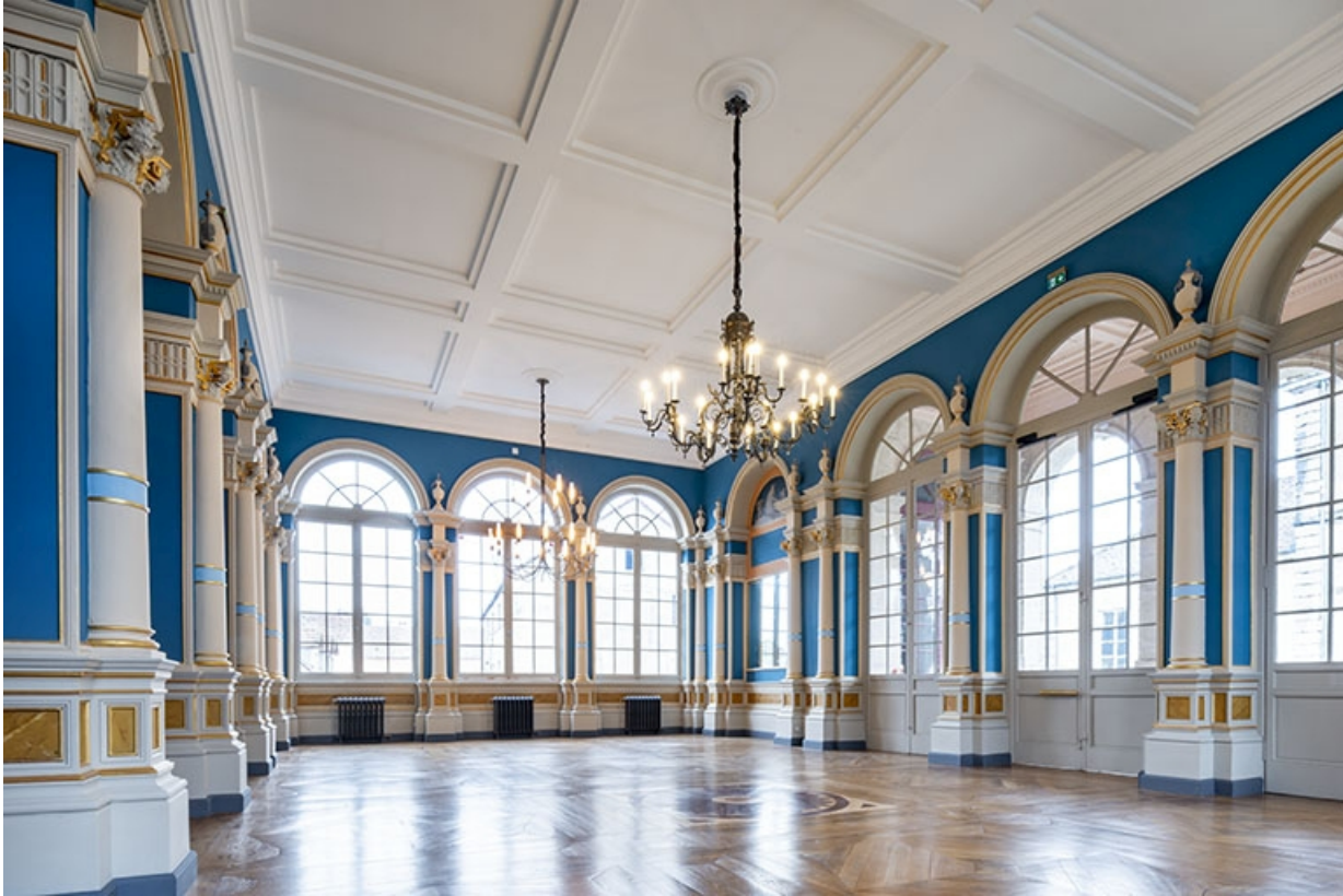
Vue d'ensemble du foyer, vers le côté cour.