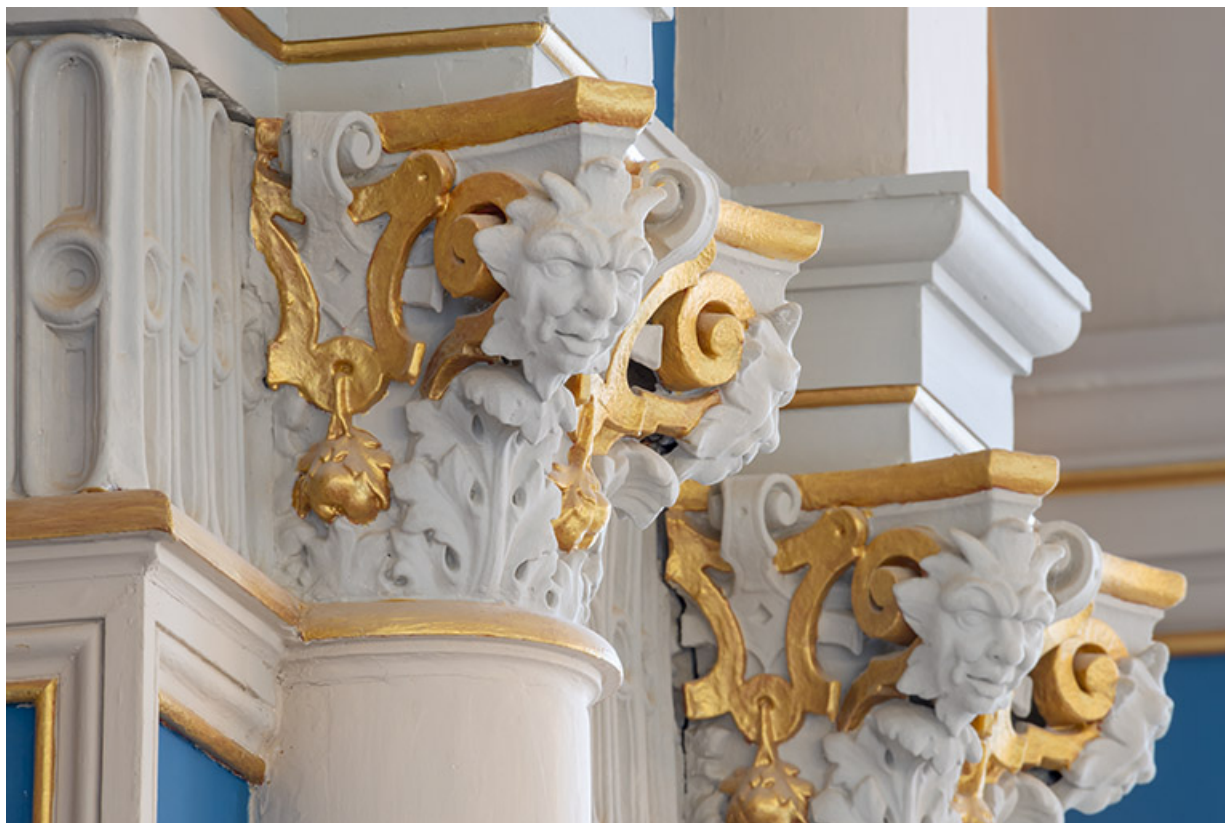
Foyer : chapiteaux avec masques.