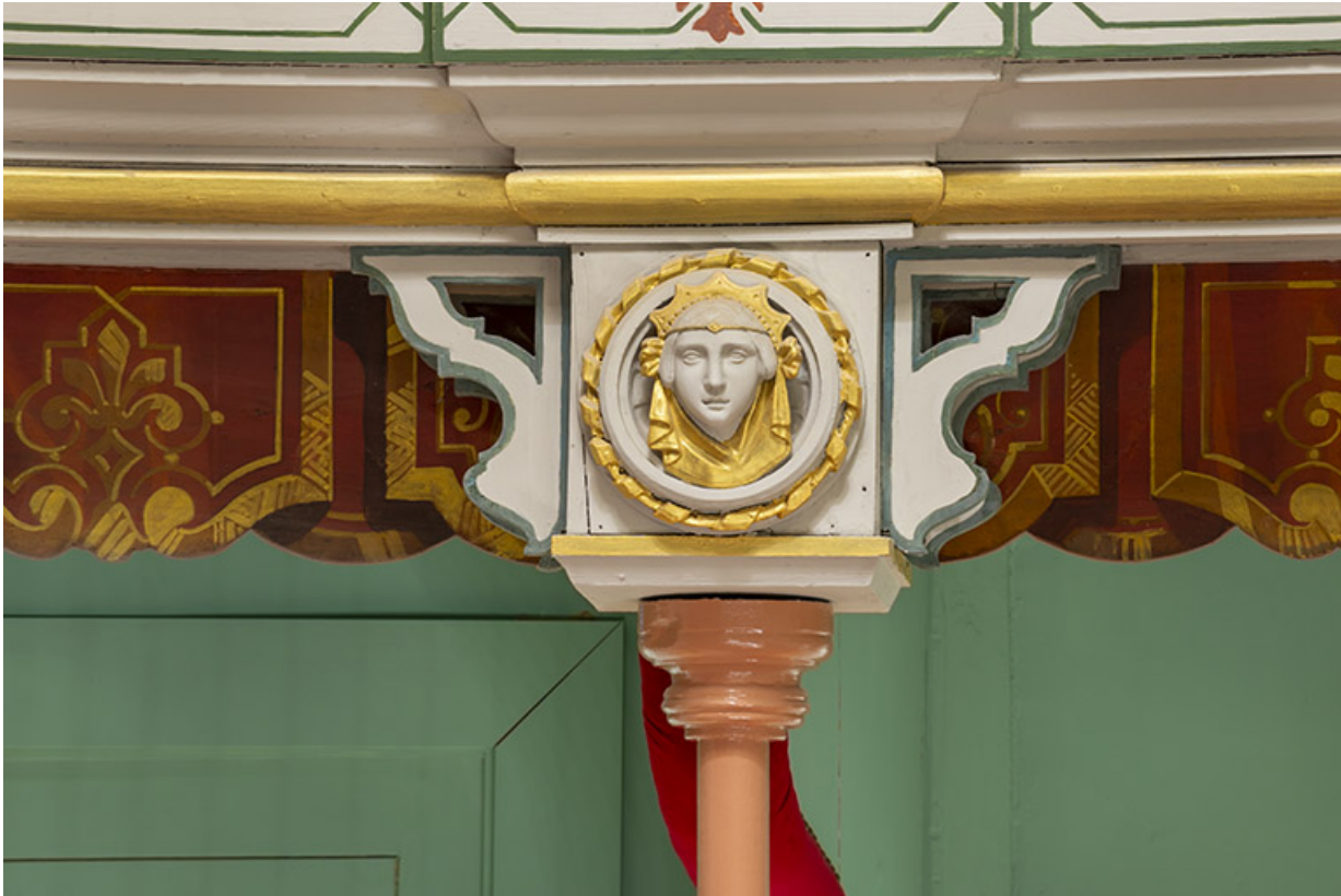
Salle : décor d'un culot du 2e balcon : 2e tête de femme. 39, Dole, 30 rue du Mont-Roland