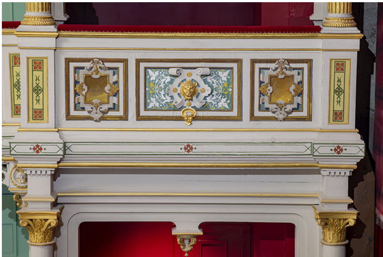
Salle : décor du garde-corps de la loge d'avant-scène côté cour, au 2e balcon. 39, Dole, 30 rue du Mont-Roland