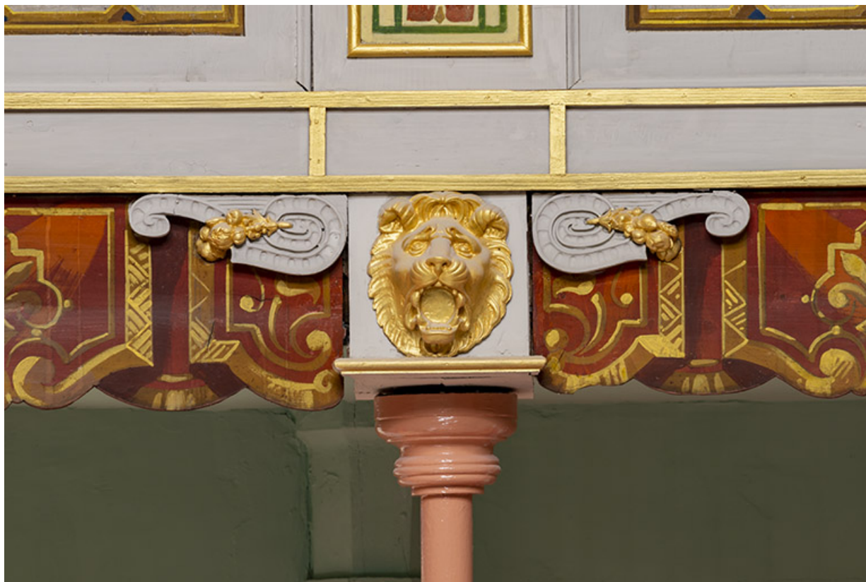
Salle : décor d'un culot du 3e balcon : mufle de lion. 39, Dole, 30 rue du Mont-Roland