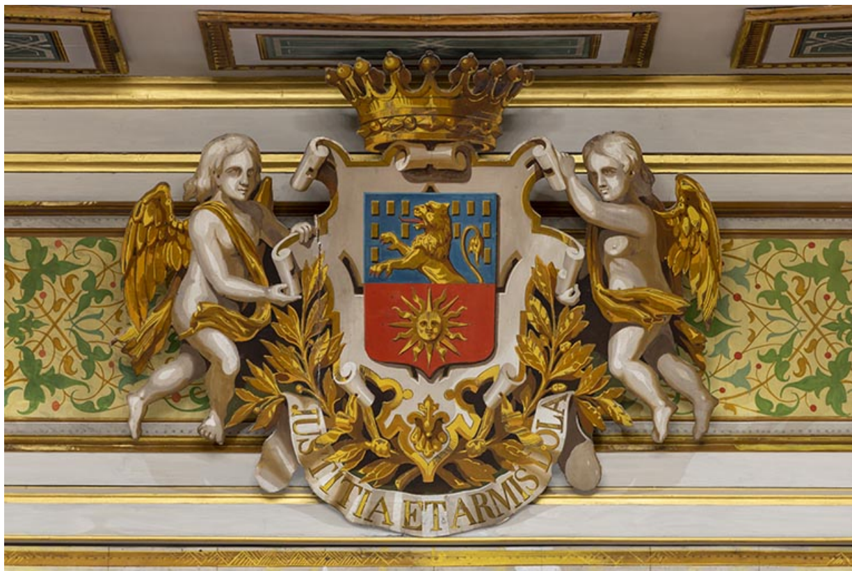
Salle : armoiries et devise de la ville de Dole, fixées sur le lambrequin.