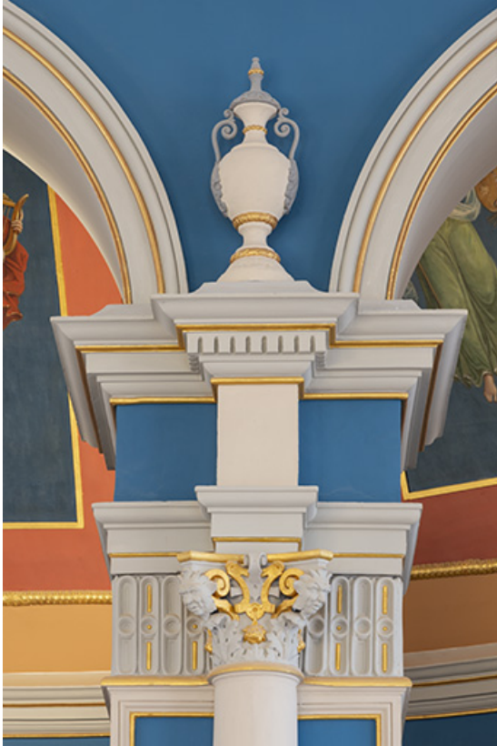
Foyer : chapiteau, entablement et vase.