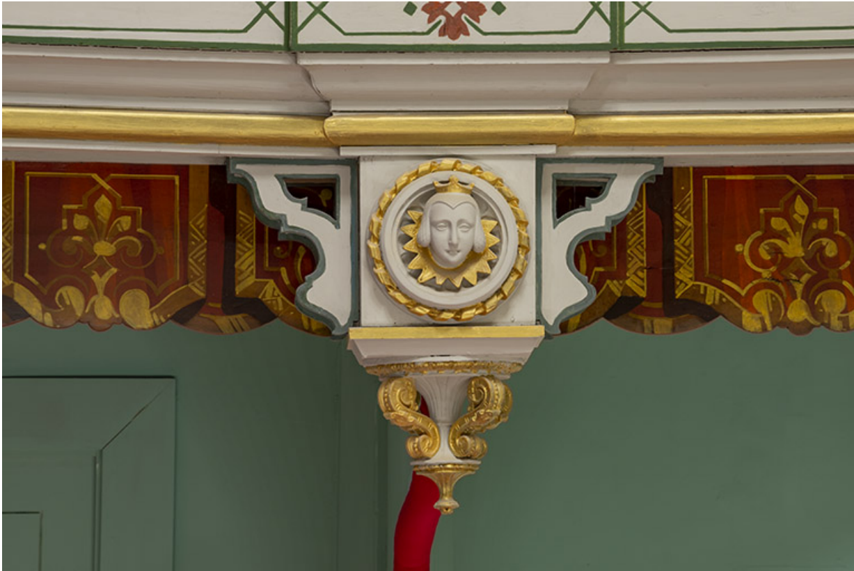
Salle : décor d'un culot du 2e balcon : 1re tête de femme.