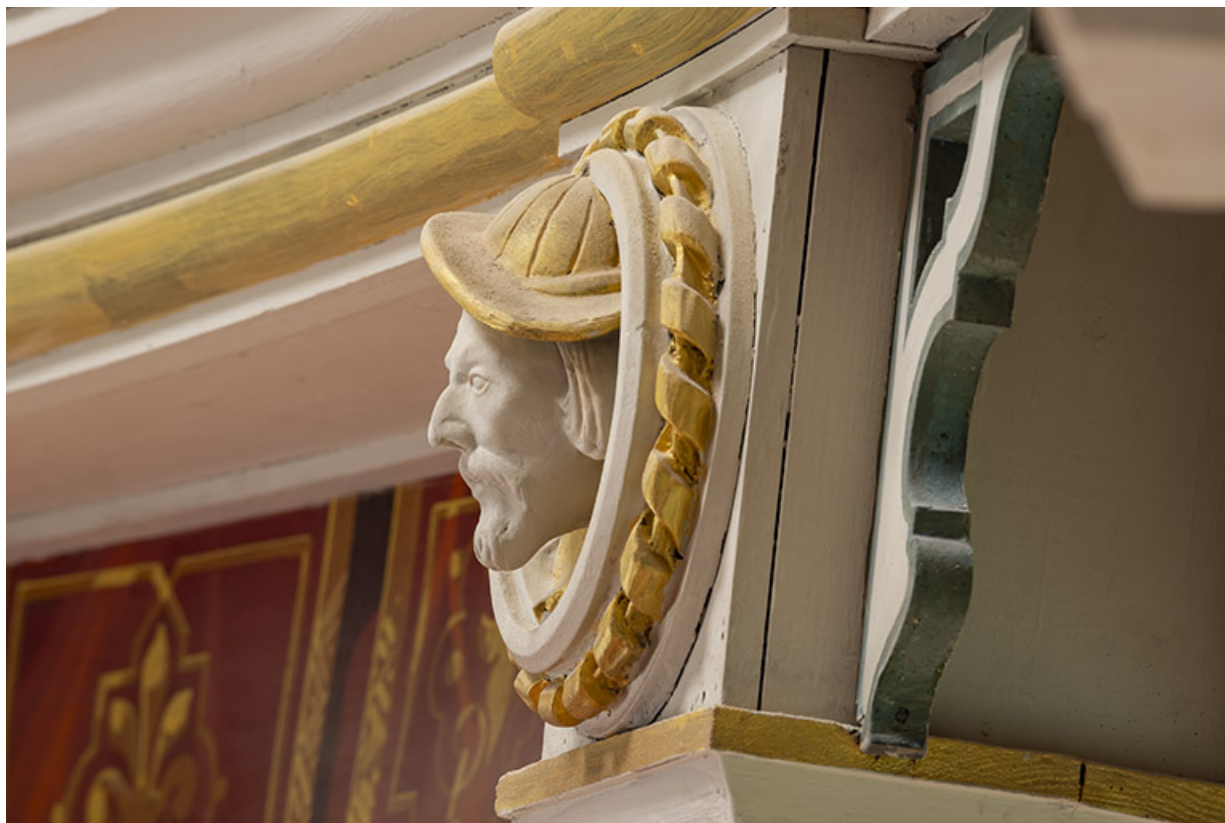
Salle : décor d'un culot du 2e balcon : 1re tête d'homme (vue de profil). 39, Dole, 30 rue du Mont-Roland