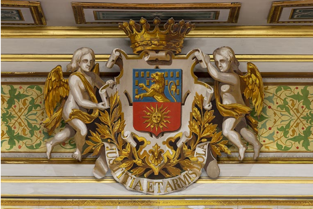
Salle : armoiries et devise de la ville de Dole, fixées sur le lambrequin.