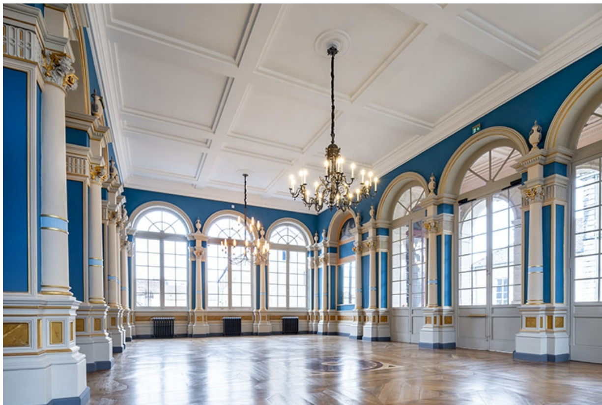
Vue d'ensemble du foyer, vers le côté cour.