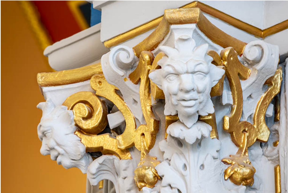
Foyer : détail d'un chapiteau et des masques.