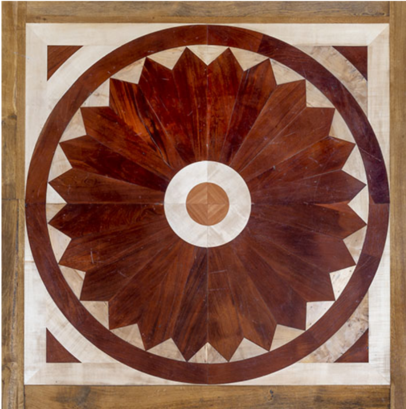
Foyer : rosace au parquet.