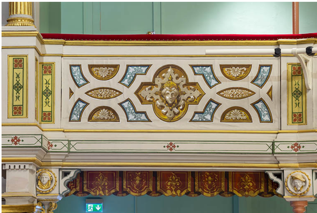
Salle : décor du garde-corps du 2e balcon, près de la loge d'avant-scène côté cour. 39, Dole, 30 rue du Mont-Roland