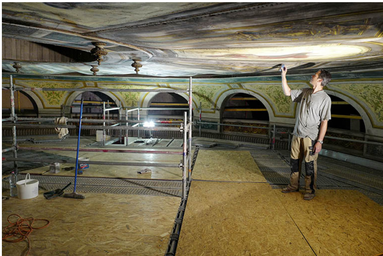
Plafond de la salle en cours de restauration, en 2020.