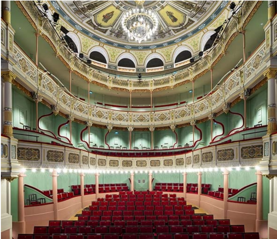
Salle : vue d'ensemble depuis la scène.