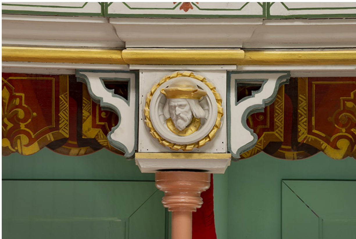
Salle : décor d'un culot du 2e balcon : 2e tête d'homme. 39, Dole, 30 rue du Mont-Roland