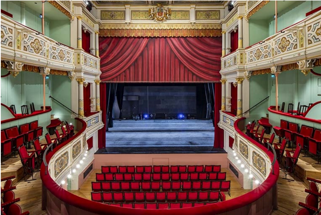
Salle : vue d'ensemble vers la scène.