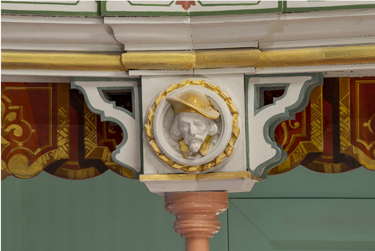
Salle : décor d'un culot du 2e balcon : 1re tête d'homme.