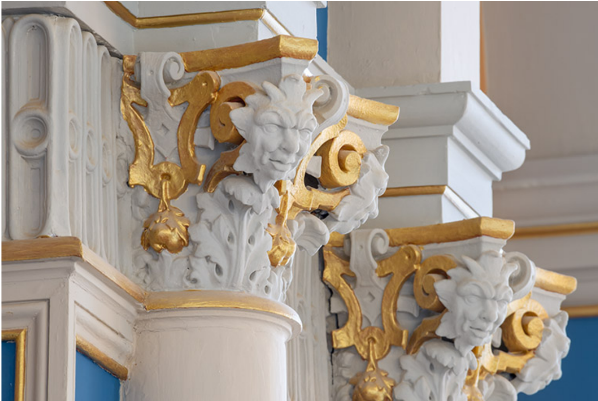
Foyer : chapiteaux avec masques.