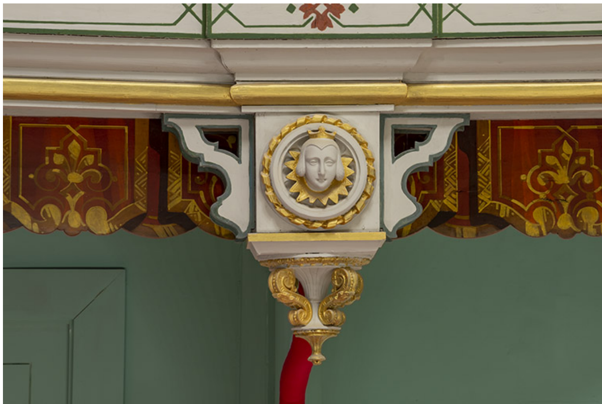
Salle : décor d'un culot du 2e balcon : 1re tête de femme. 39, Dole, 30 rue du Mont-Roland