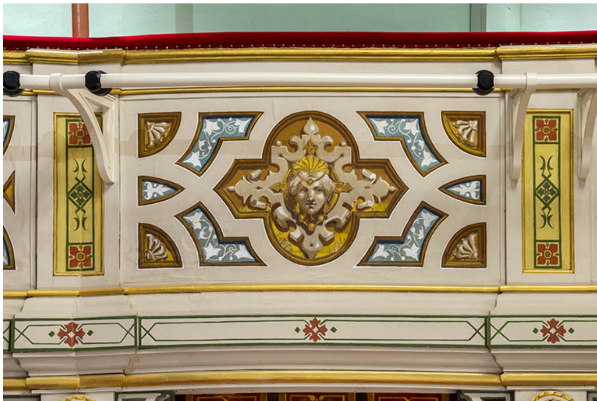
Salle : décor du garde-corps du 2e balcon.