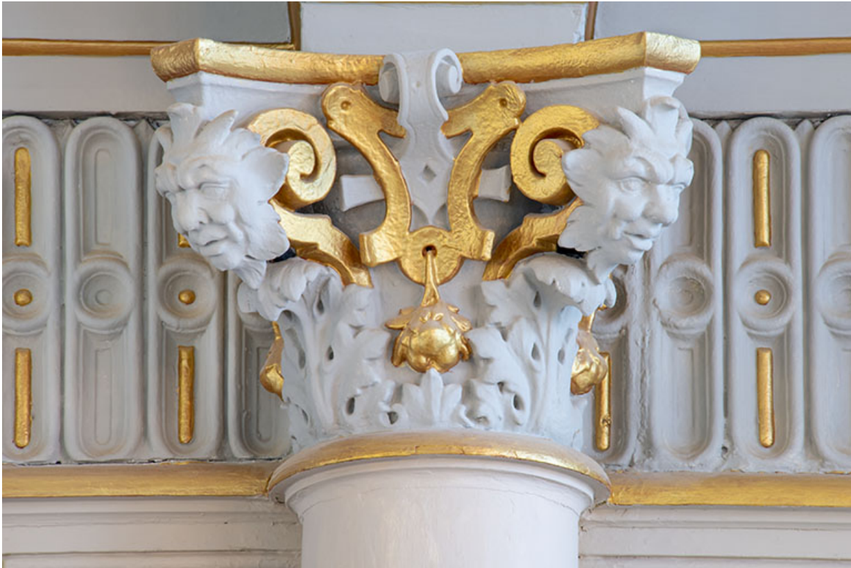
Foyer : chapiteau et masques.