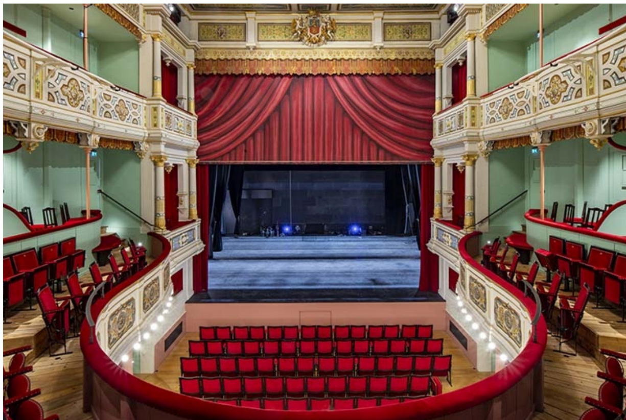
Salle : vue d'ensemble vers la scène.