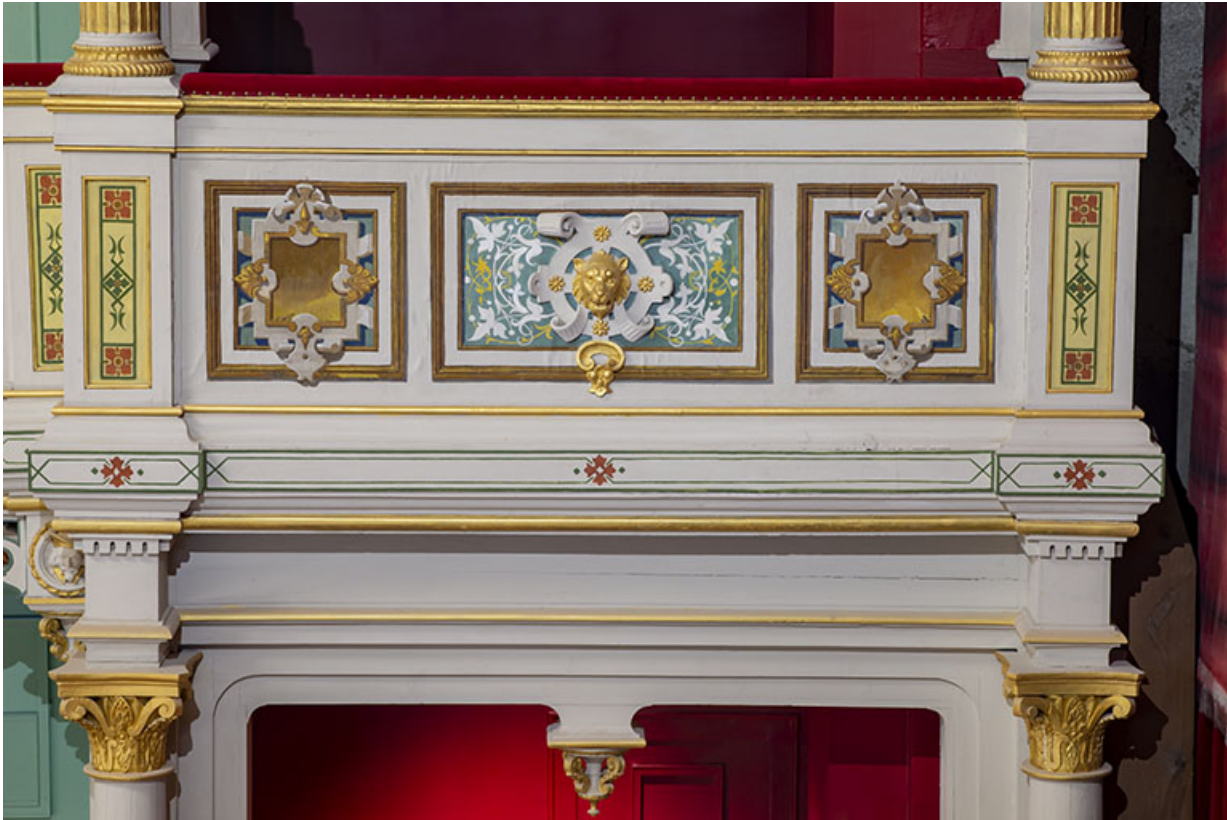
Salle : décor du garde-corps de la loge d'avant-scène côté cour, au 2e balcon. 39, Dole, 30 rue du Mont-Roland