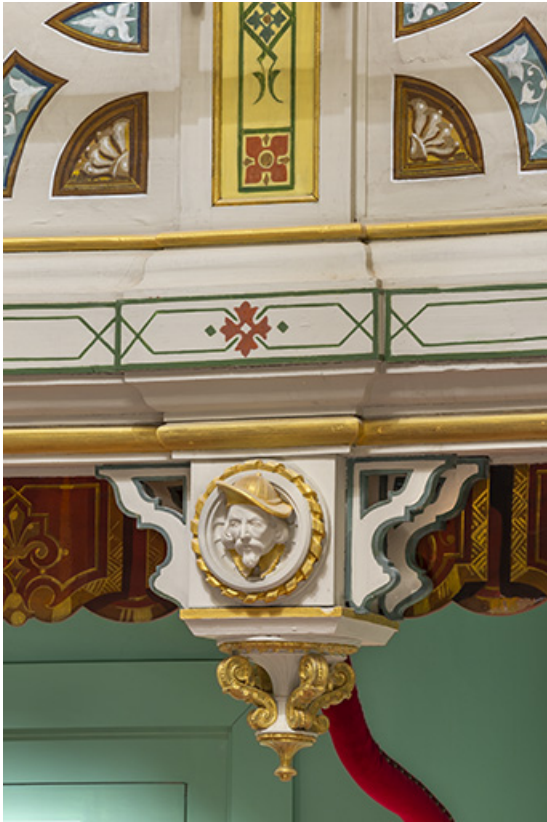
Salle : décor d'un culot du 2e balcon : 1re tête d'homme (cadrage vertical). 39, Dole, 30 rue du Mont-Roland