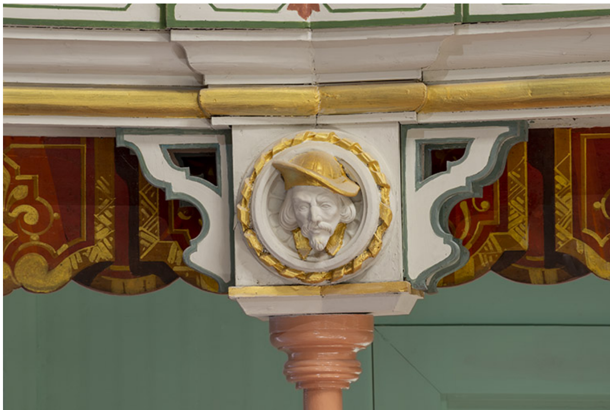
Salle : décor d'un culot du 2e balcon : 1re tête d'homme. 39, Dole, 30 rue du Mont-Roland