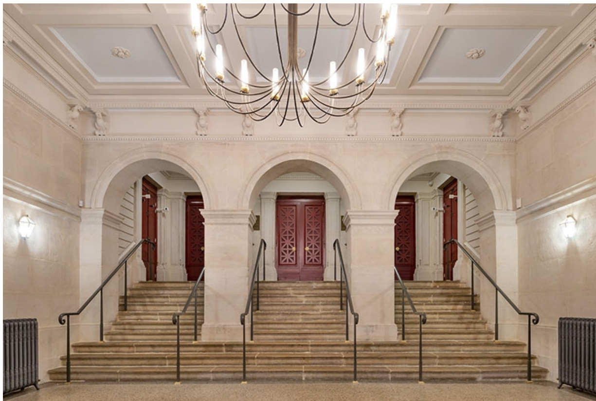
Vestibule, depuis l'entrée.