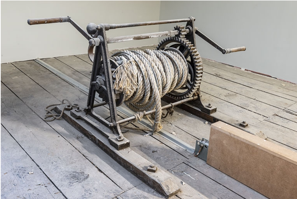
Treuil (désaffecté) du lustre de la salle.