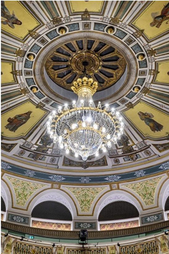
Salle : le lustre.