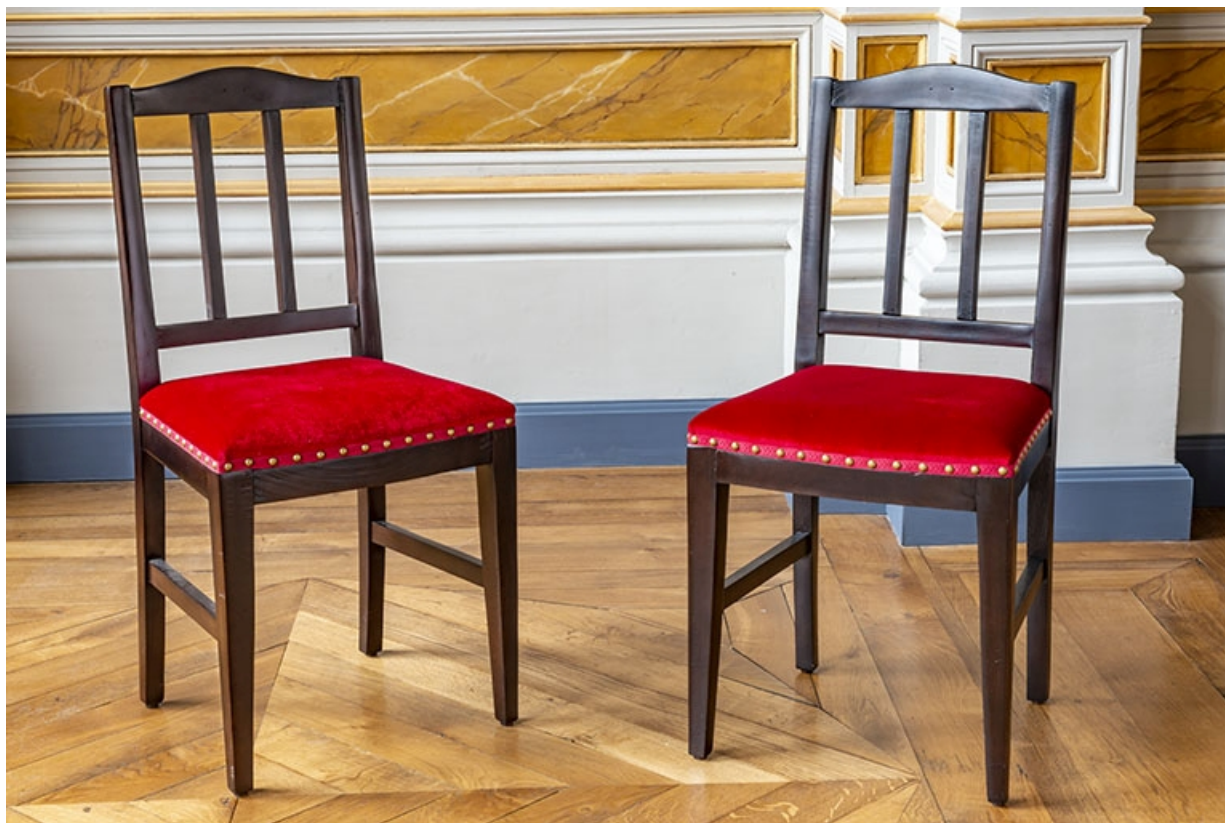
Chaises de la société Gallot Frères.