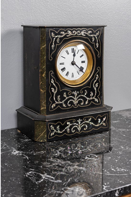
Vue d'ensemble, de trois quarts.