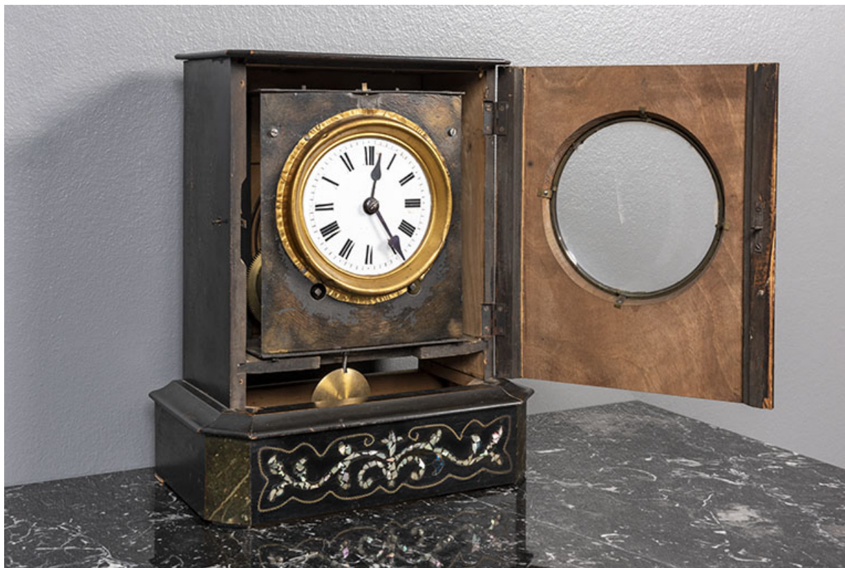
Vue d'ensemble, ouverte.