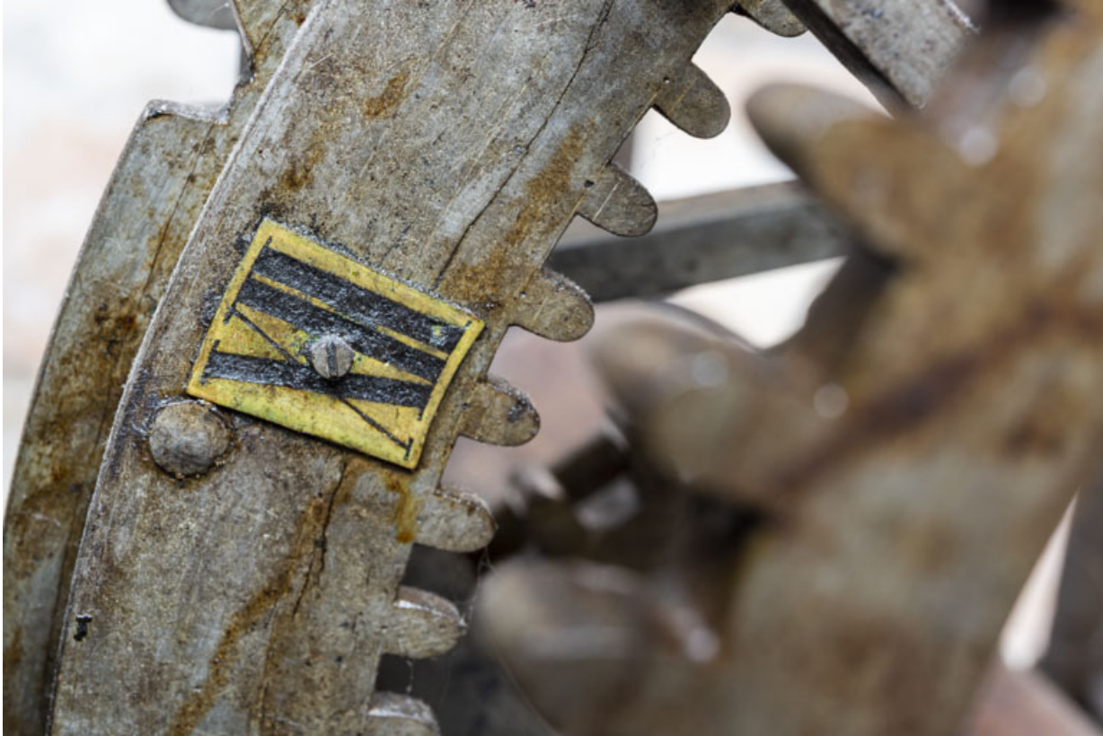
Corps arrière droit (sonnerie des quarts d'heure) : plaque en laiton rivée sur la roue de compte. 39, Orgelet place de l' Eglise