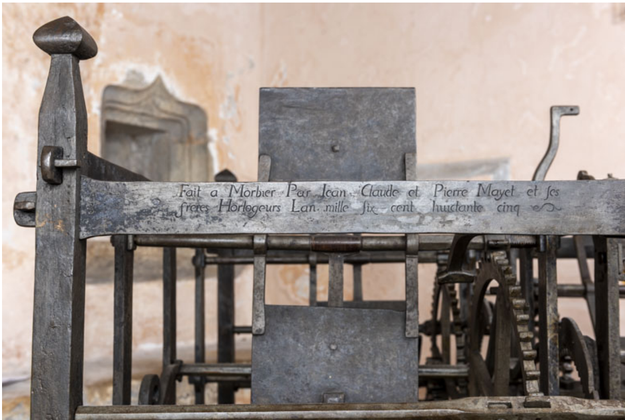
Face antérieure : inscription et date 1685.