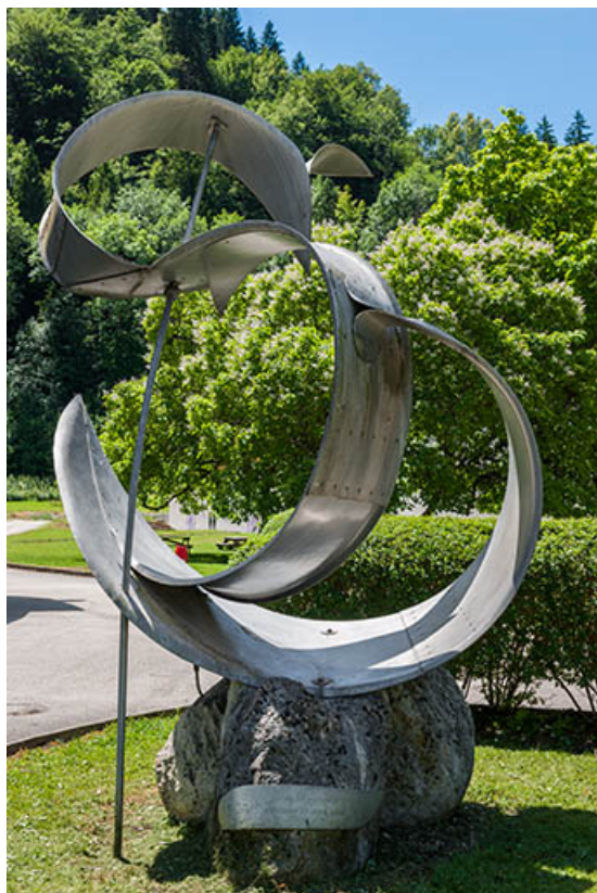
Vue d'ensemble avec cartouche.