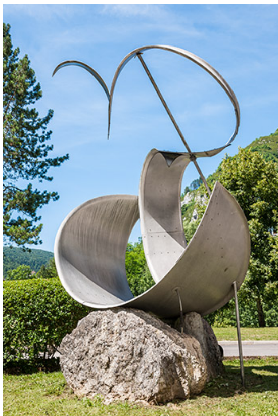
Vue trois-quart. 39, Saint-Claude