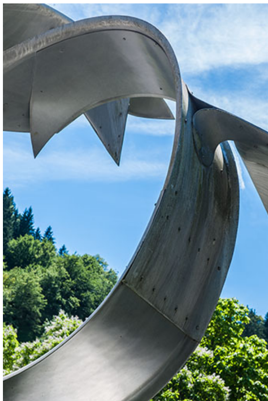
Détail du volute.