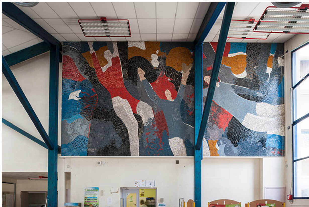
Mosaïque, vue d'ensemble.