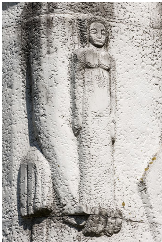
Détail : le petit personnage féminin.