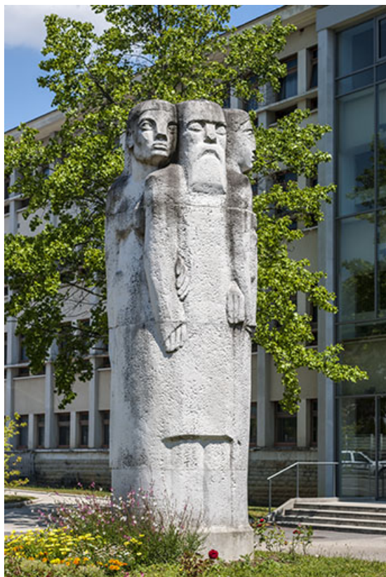
Vue rapprochée (1).