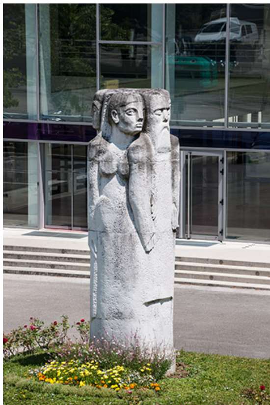
Vue rapprochée (3).