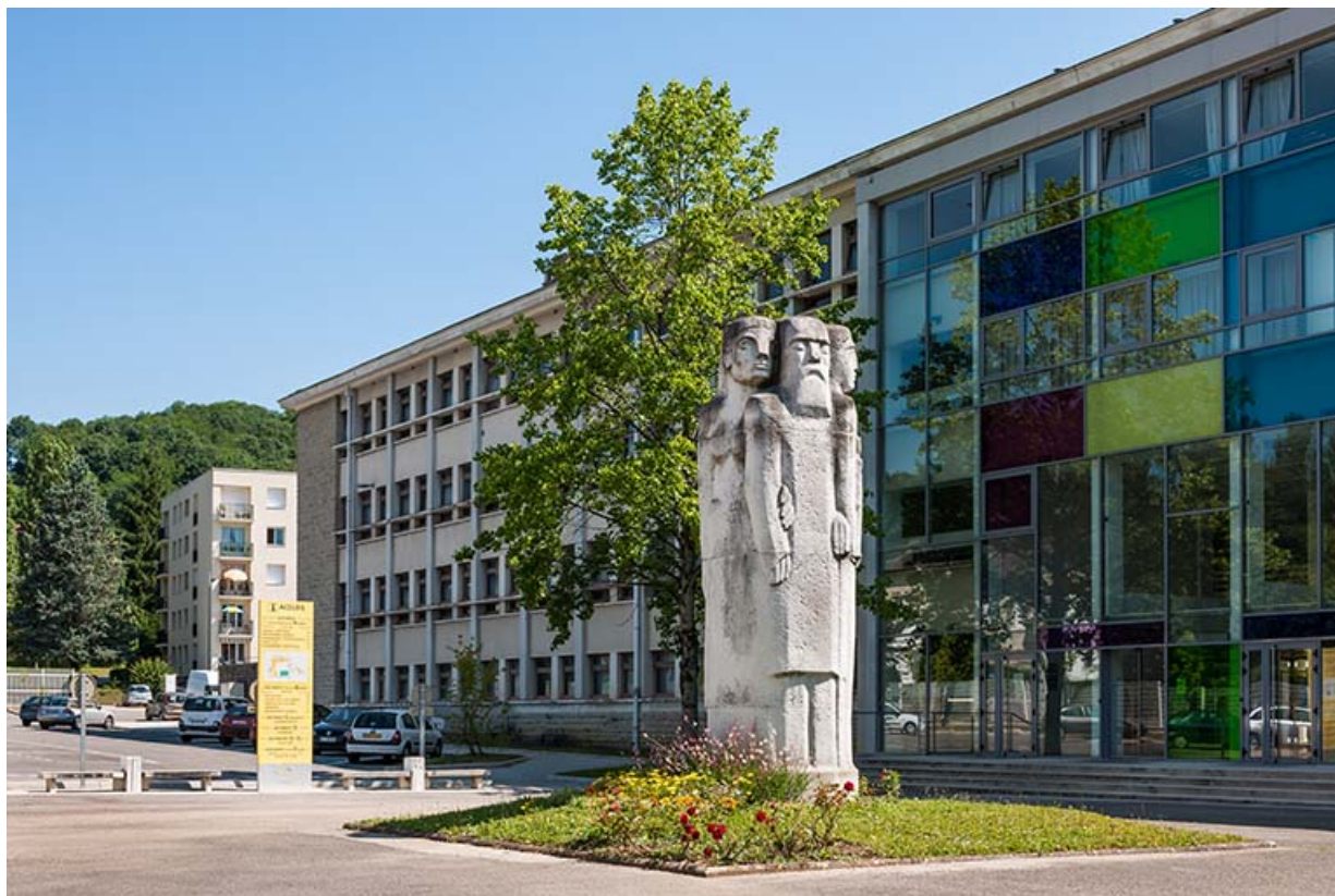
Sculpture 1% : vue générale