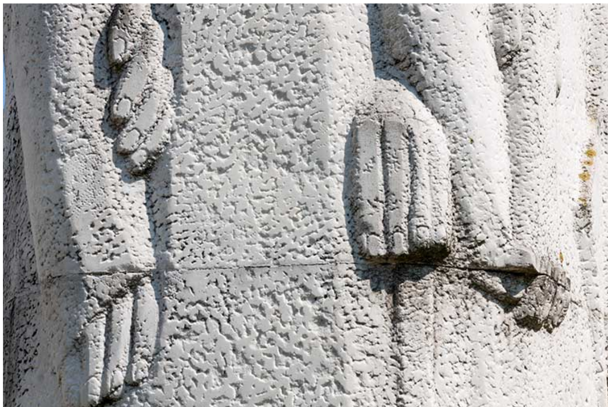
Détail des mains.