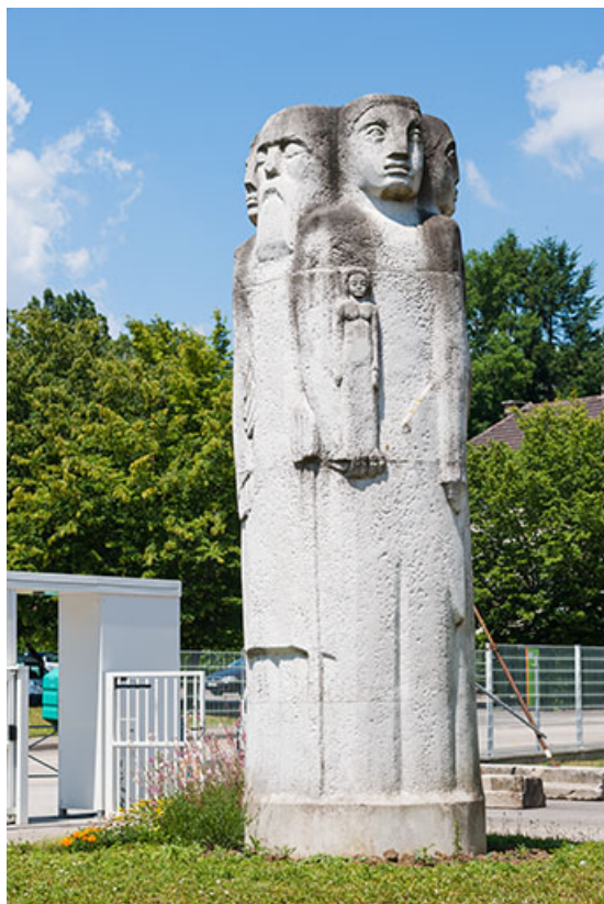
Vue rapprochée (2).