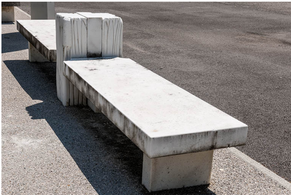
Banc : vue générale.