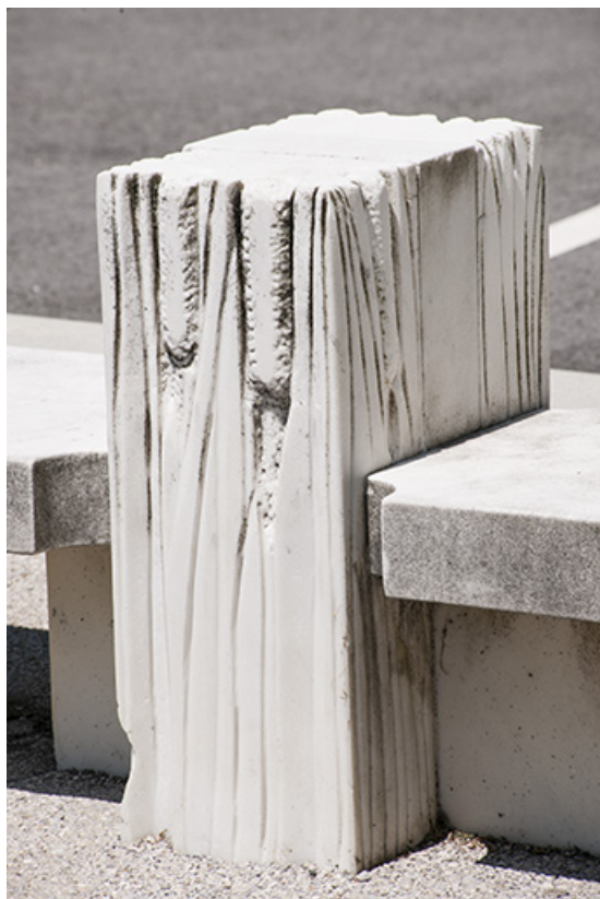
Banc : détail.