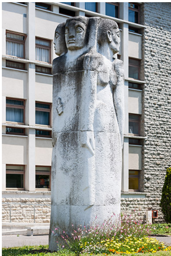
Vue rapprochée (4).