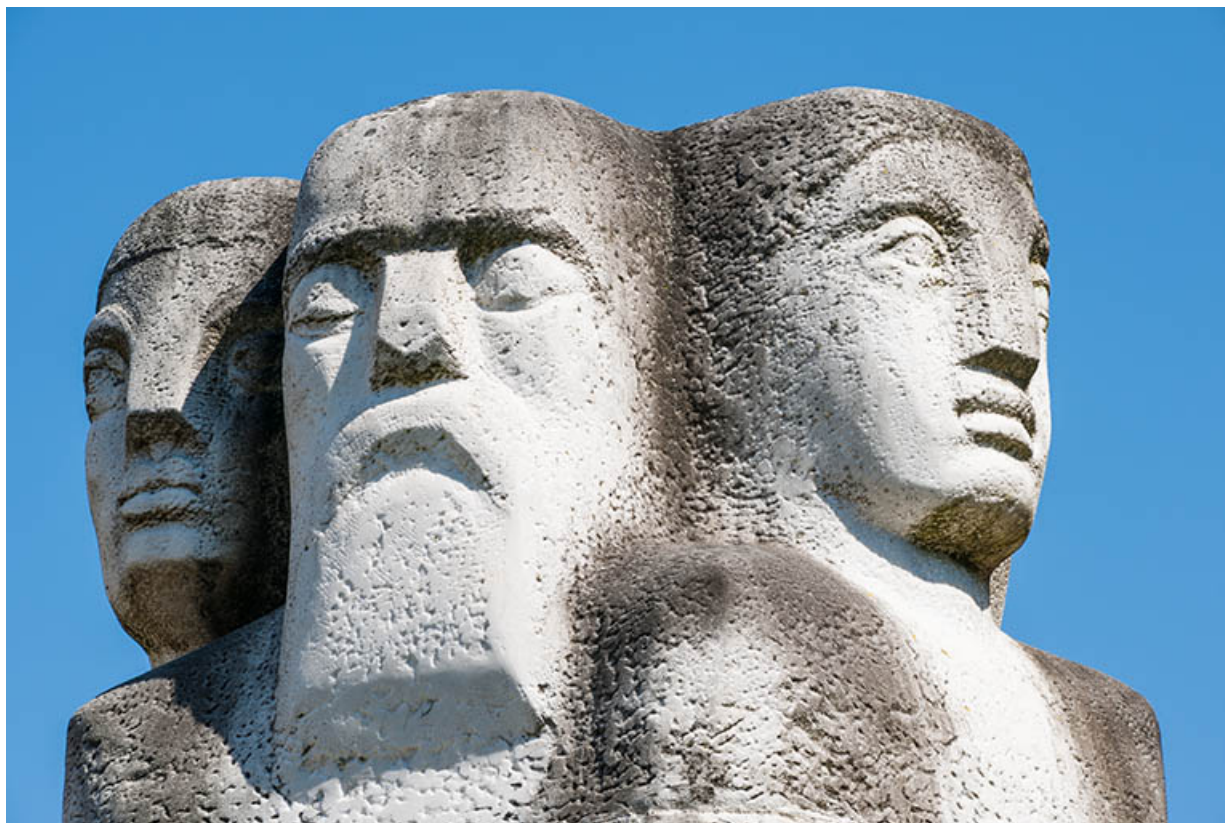
Détail des têtes : homme de face et profil femme.