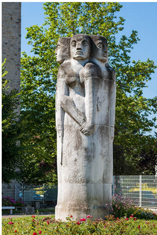
Vue rapprochée (5).