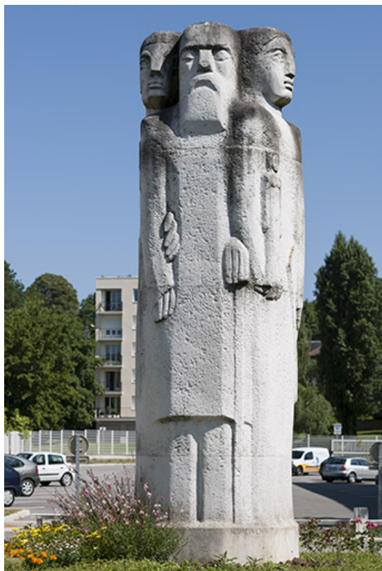
Vue rapprochée (6).