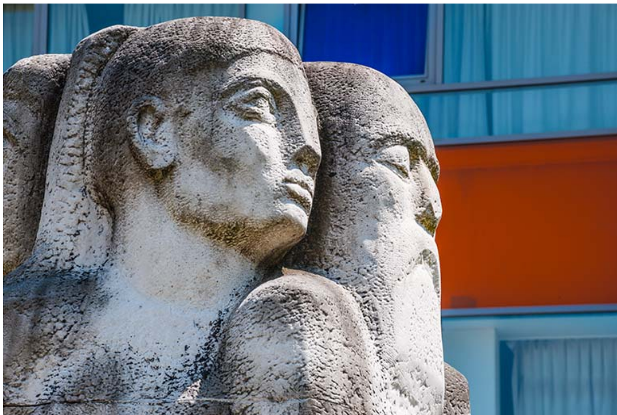
Détail des têtes : profils femme et homme.