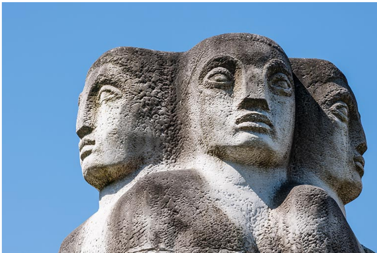
Détail des têtes.