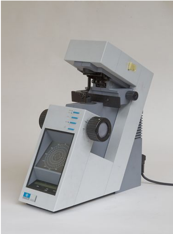
Frontofocomètre projecteur, vu de trois quarts droite.