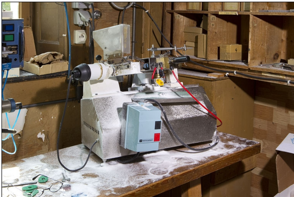
Machine SLO 1P de la société Costruzioni Meccaniche Speciali.