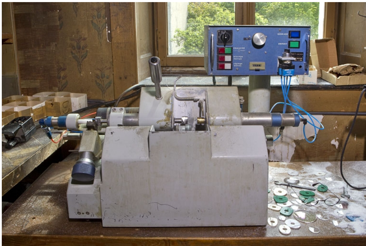
Machine des Ets Paget Frères. 39, Morez, 66 rue de la République