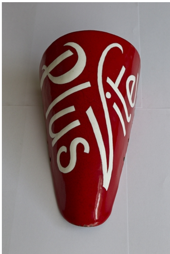
Exemple de production émaillée : élément du bobsleigh " Plus vite ". 39, Morez, 171 rue de la République