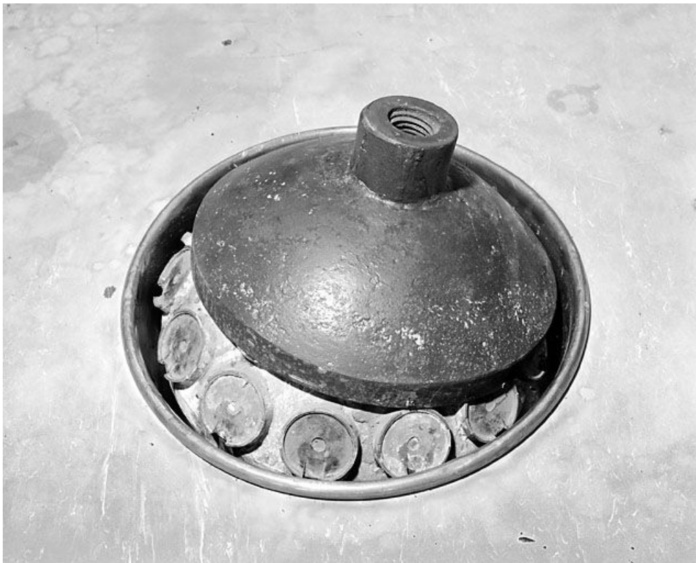
La " balle " et le " bassin ".