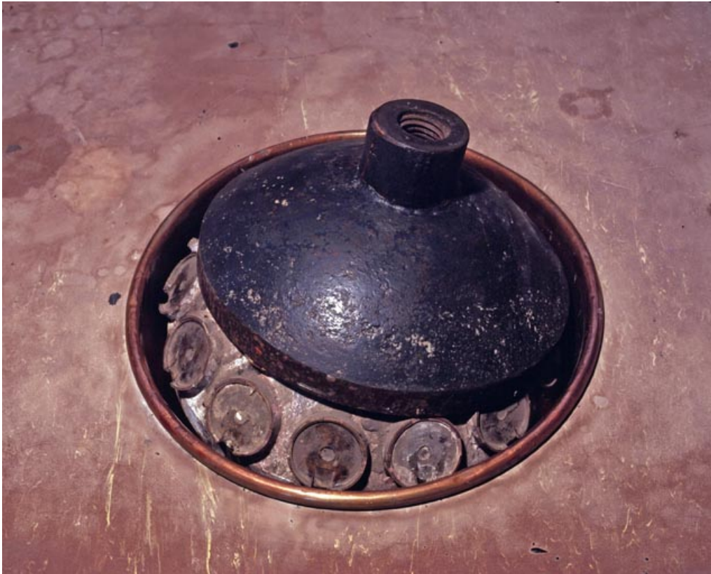
La " balle " et le " bassin ".