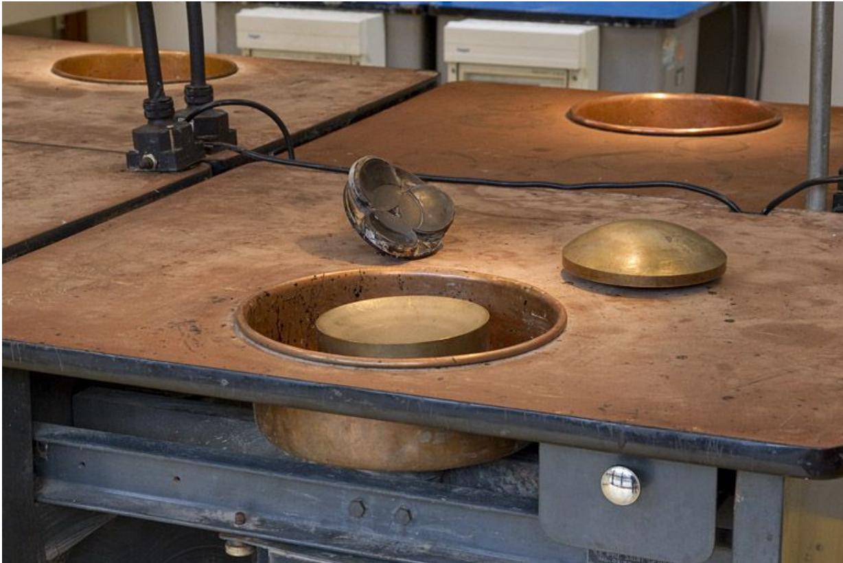
Plateau d'une machine et accessoires ("balle" et "bassin").