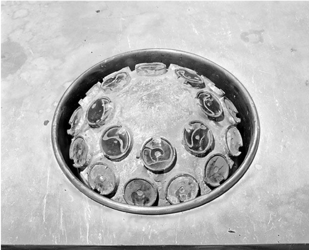
La " balle " et les supports pour le collage des verres.