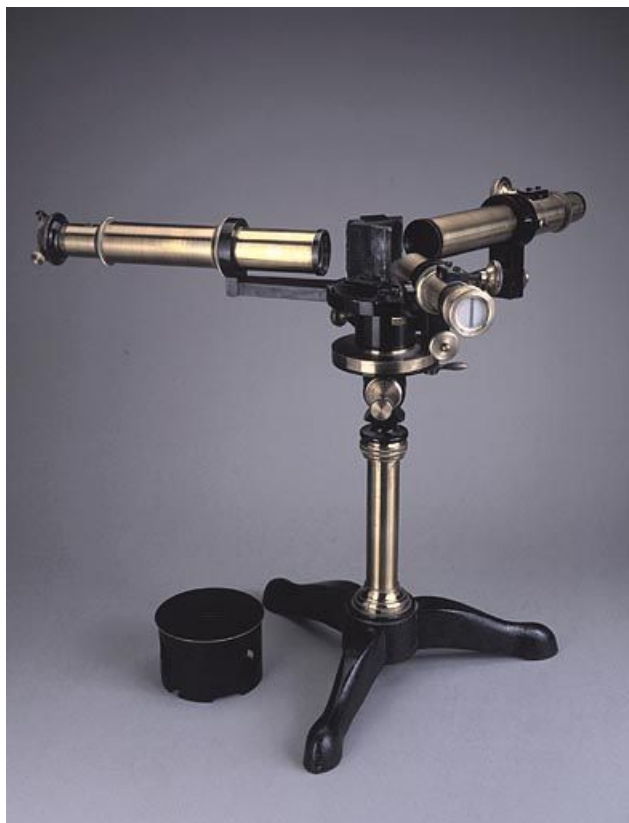
Vue d'ensemble, prisme apparent.