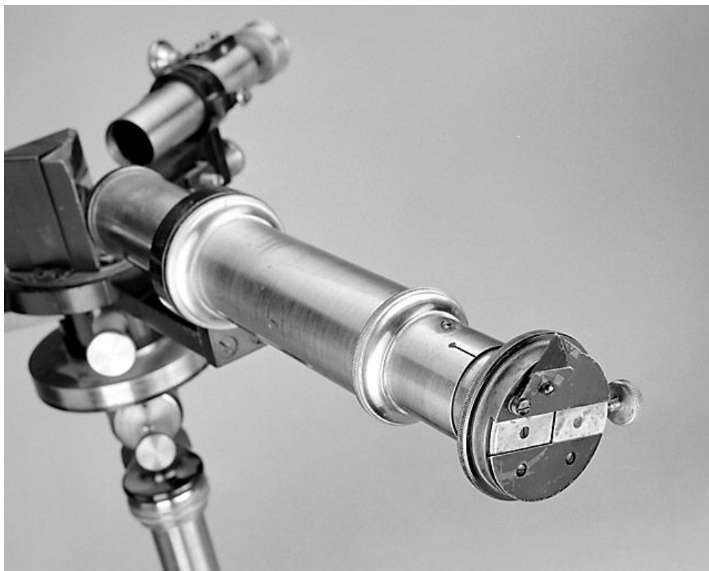
Détail d'un collimateur.