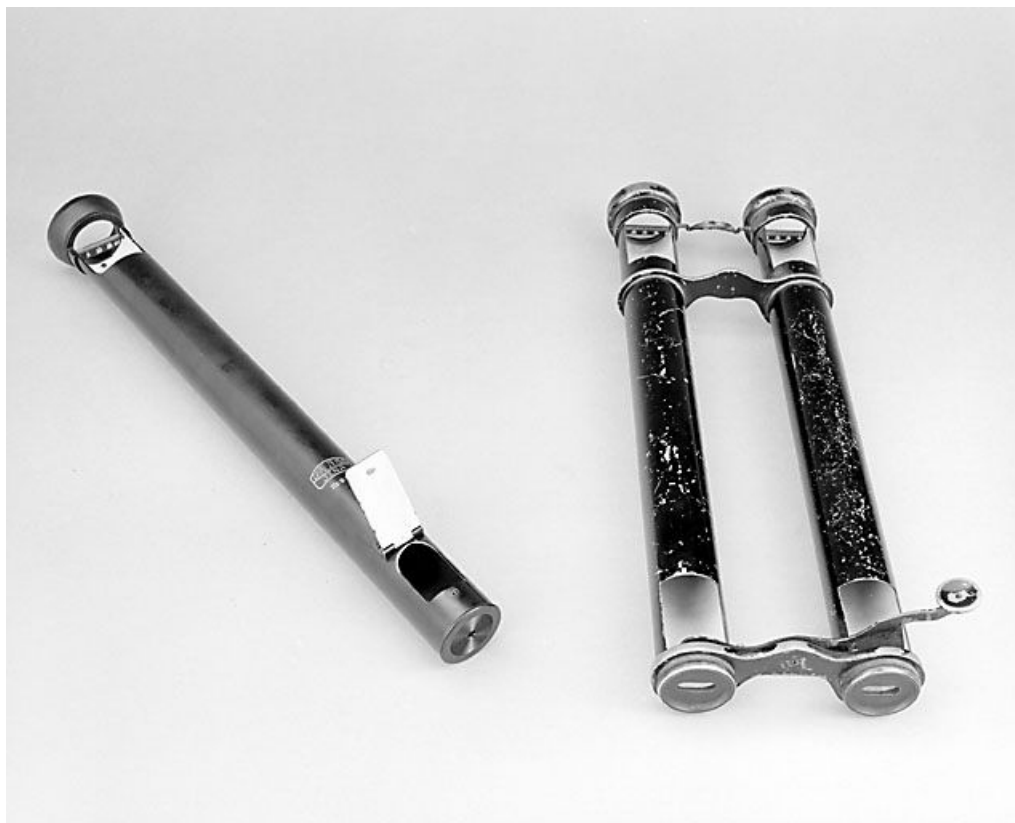
Vue d'ensemble du premier pupillomètre Zeiss et du pupillomètre sans marque.