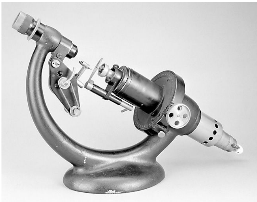
Vue d'ensemble : côté droit.