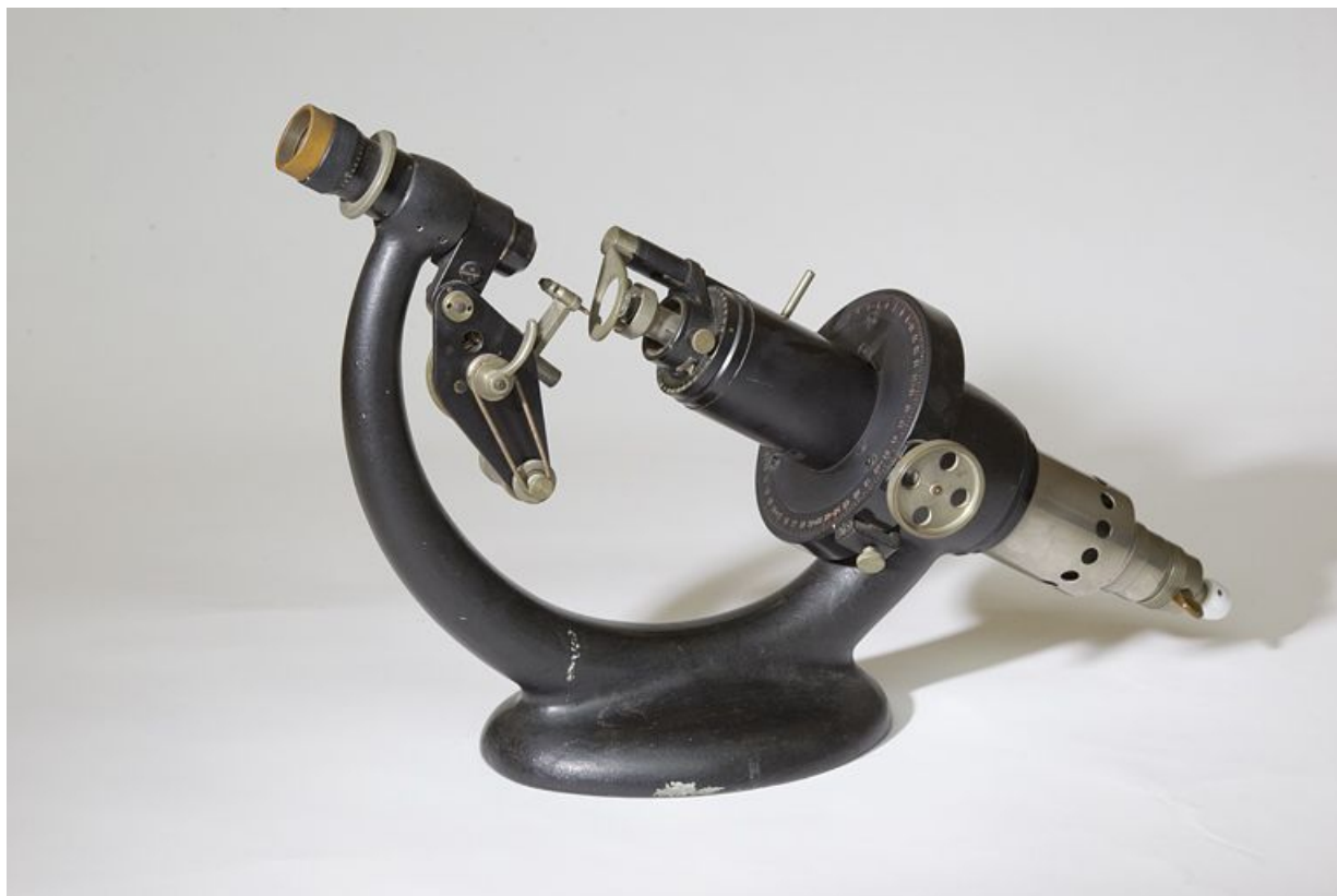
Vue d'ensemble : côté droit.