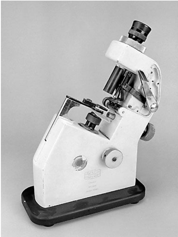
Vue d'ensemble : côté gauche.