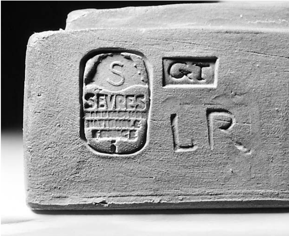
Marque de la Manufacture de Sèvres.