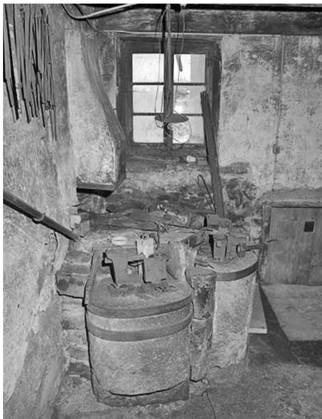
Vue d'ensemble des trois postes de travail.

39, La Mouille C.D. 69 E2, lieudit : le Bourgeat d'Amont