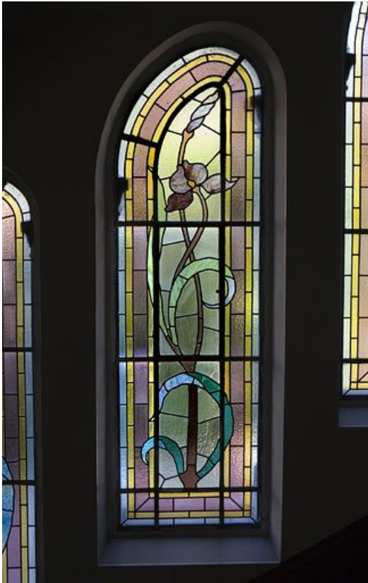
Deuxième registre, verrière centrale. 39, Morez, 5 avenue Charles de Gaulle