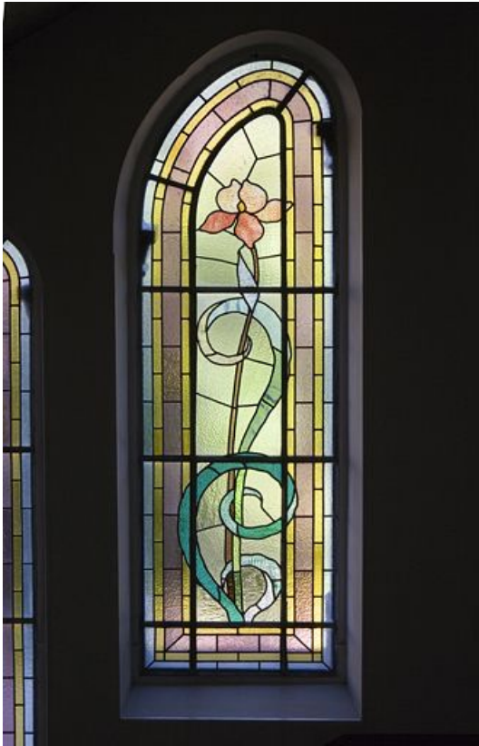
Deuxième registre, verrière droite.