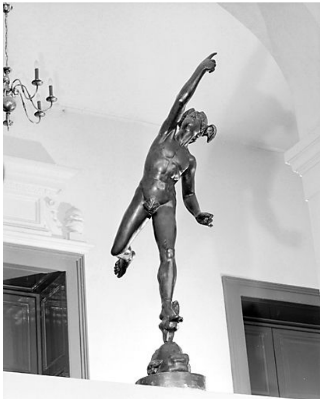
Vue d'ensemble, de trois quarts gauche.