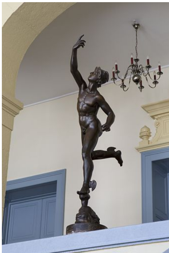
Vue d'ensemble, de trois quarts droite.