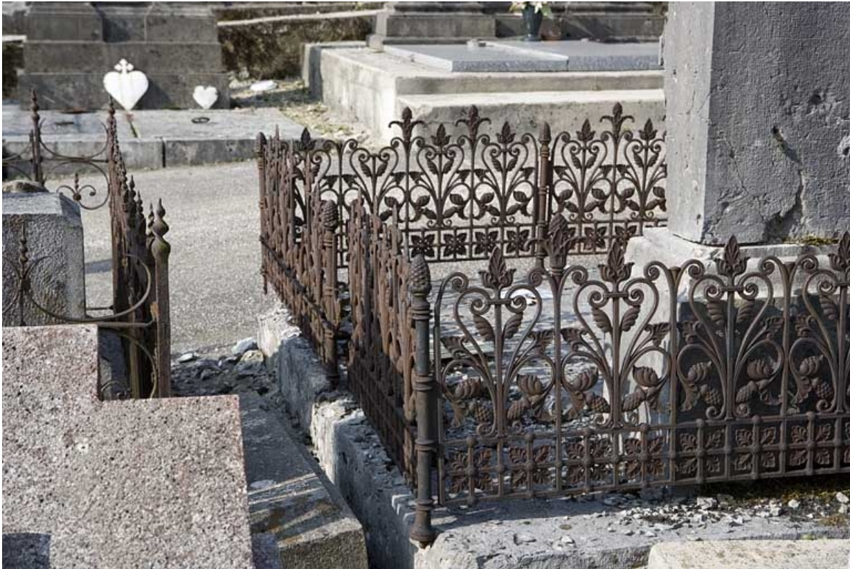
Vue d'ensemble : faces postérieure et latérale droite.

39, Morez, 10 allée du 3 Septembre, lieudit : cimetière, quartier 2