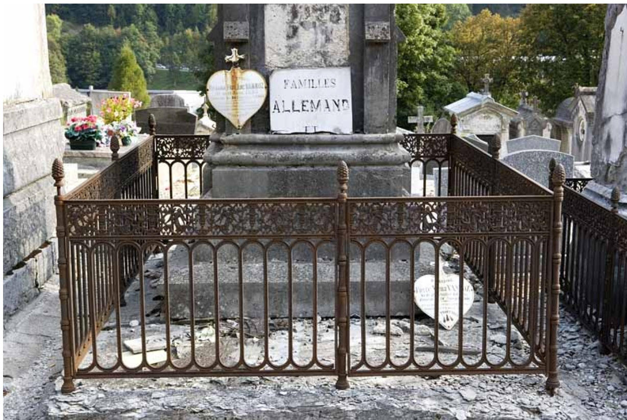
Vue d'ensemble, de la face antérieure.

39, Morez, 10 allée du 3 Septembre, lieudit : cimetière, quartier 2