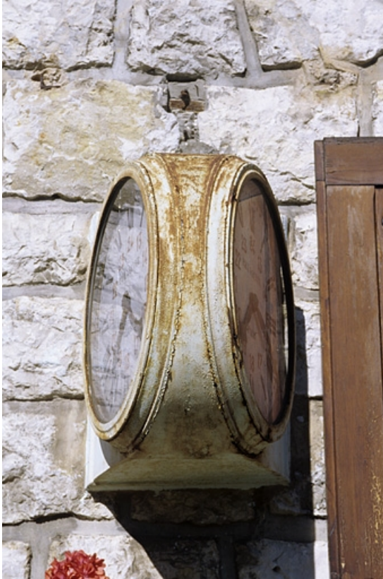
Vue de profil.