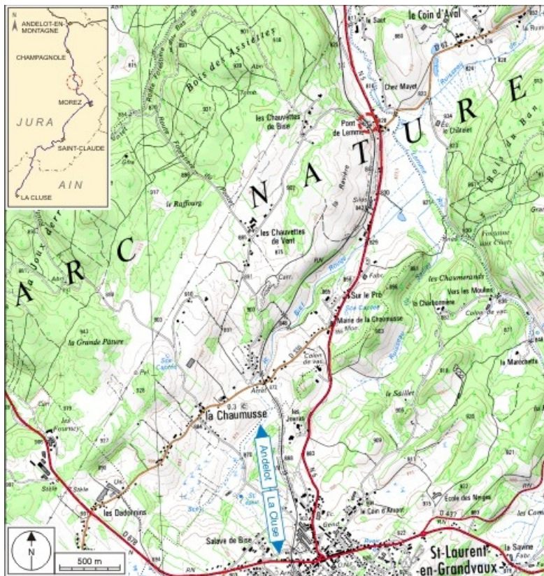
Carte et schéma de localisation. Carte topographique, IGN, 2000, dalle F087_049, échelle 1:25 000. Scan 25, licence n° 2008/CISE/2968.

39, La Chaumusse, lieudit : Pont de Lemme