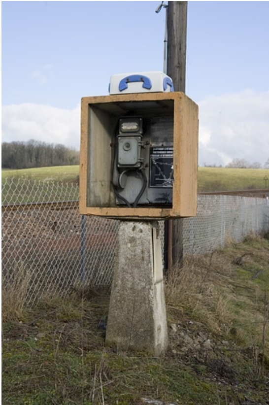
Téléphone oriental : vue d'ensemble de l'édicule.

39, Ardon R.N. 5, lieudit : Pont de Gratteroche