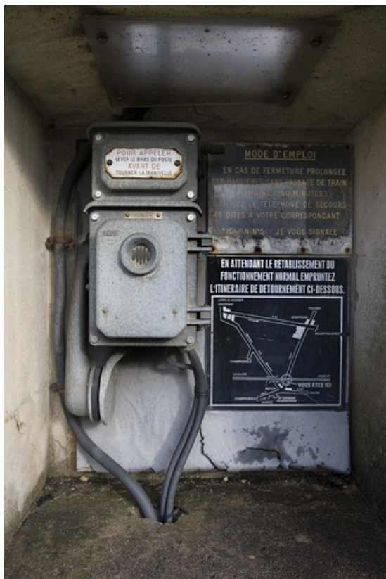
Téléphone oriental : vue rapprochée.

39, Ardon R.N. 5, lieudit : Pont de Gratteroche