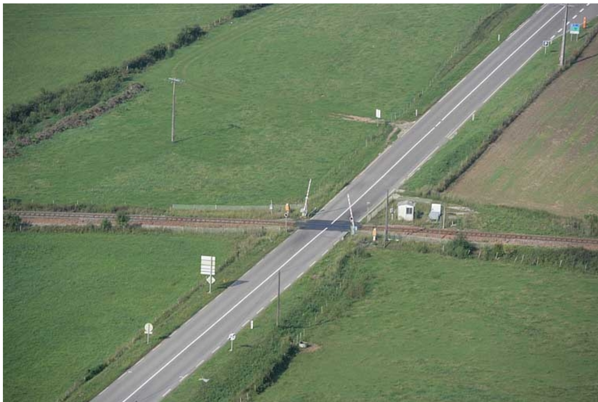
Vue aérienne du passage à niveau, depuis le sud-est.

39, Ardon R.N. 5, lieudit : Pont de Gratteroche