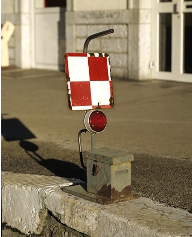
Une lampe vue de trois quarts.