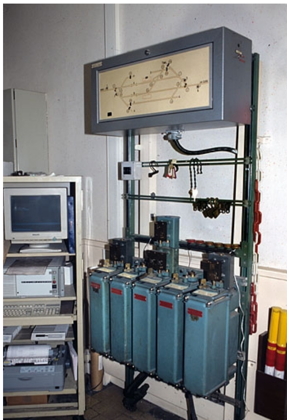
Vue d'ensemble, de trois quarts droite. Le tableau de contrôle optique surmonte les commutateurs. A gauche, ordinateur du système CAPI (cantonement assisté par informatique).