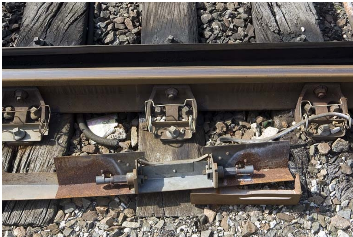
Exemple de rampe de réchauffage au gaz, sur un autre appareil : la rampe démontée.