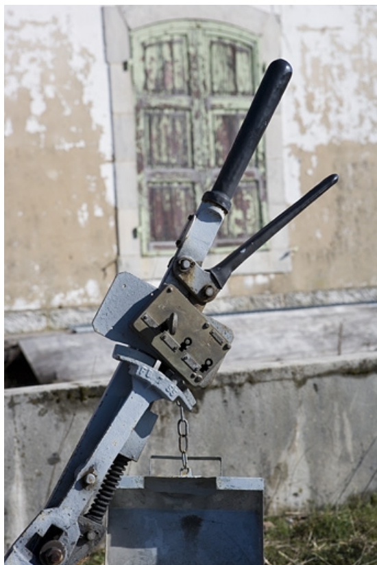
Levier de manoeuvre : détail de la serrure et de sa clef.