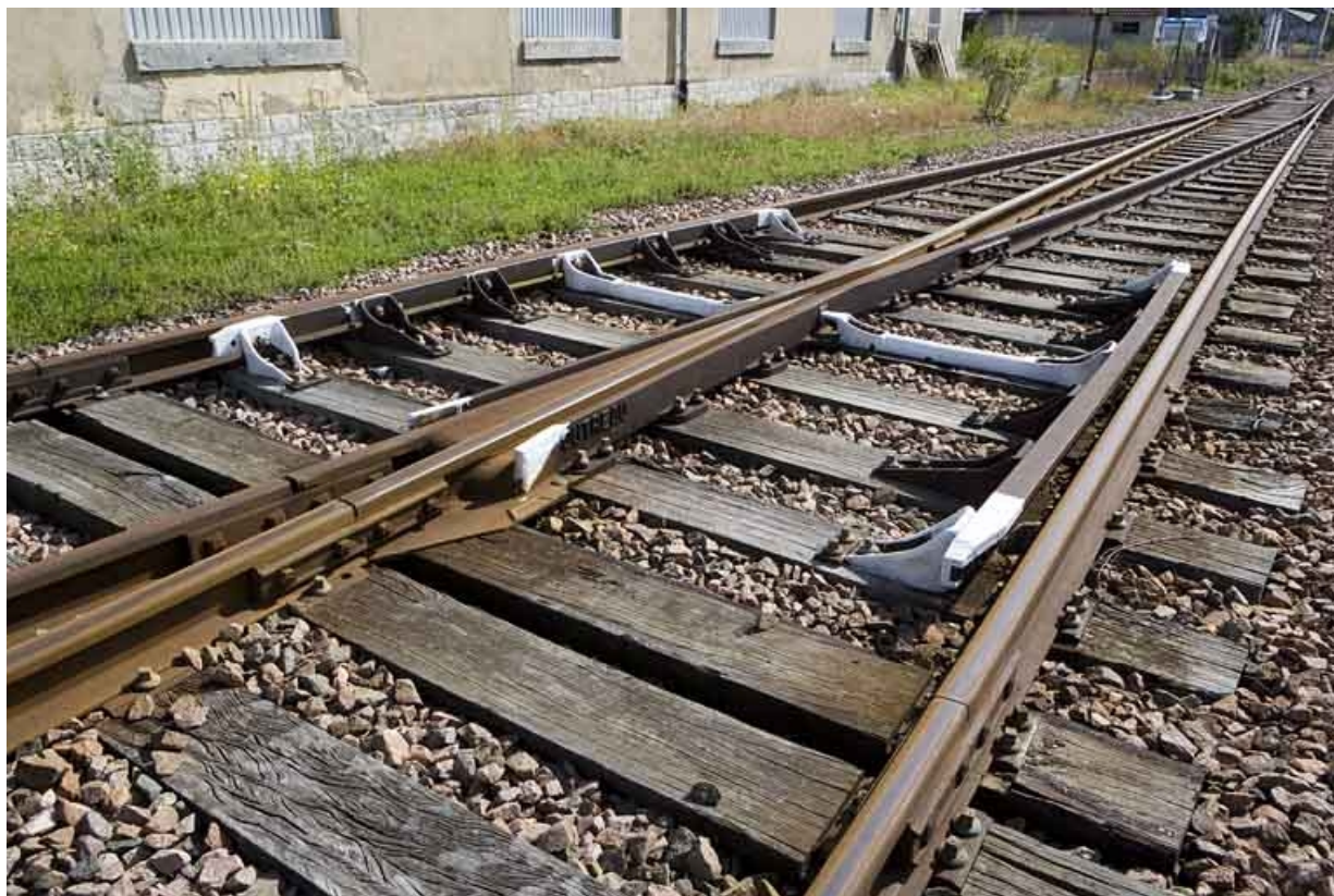
Vue d'ensemble de la partie croisement, depuis le côté Andelot-en-Montagne. Cœur de croisement et entretoises (dites "mandolines").