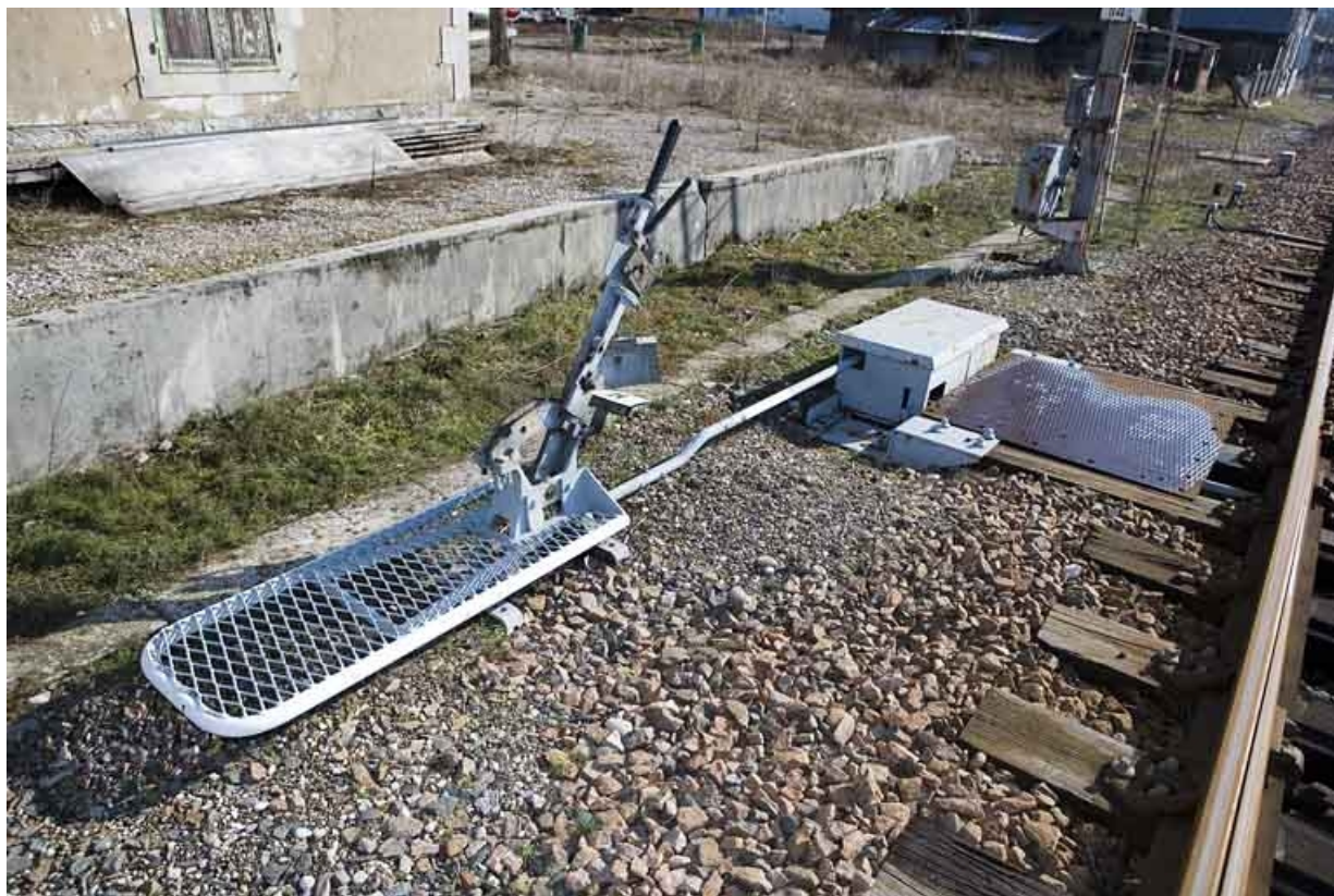
Levier de manoeuvre et boîte de protection du renvoi d'angle.