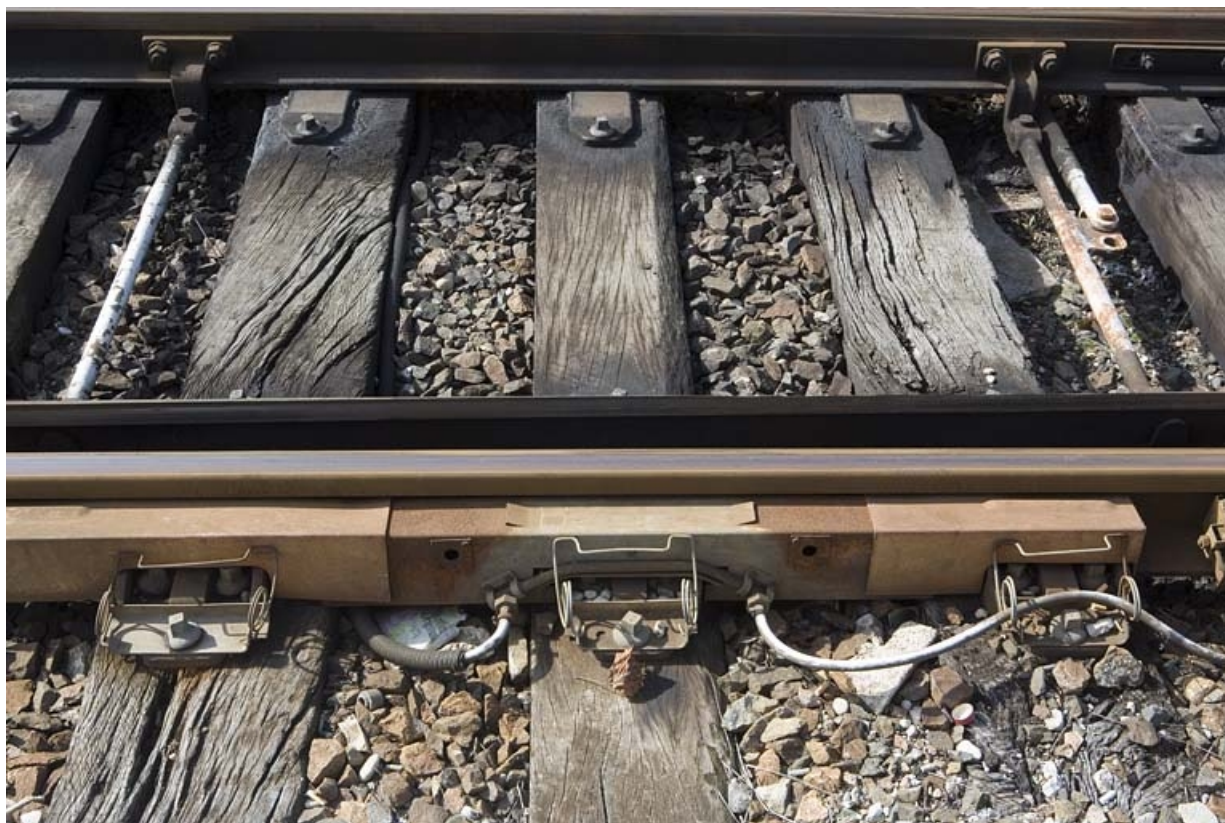
Exemple de rampe de réchauffage au gaz, sur un autre appareil : la rampe en place.