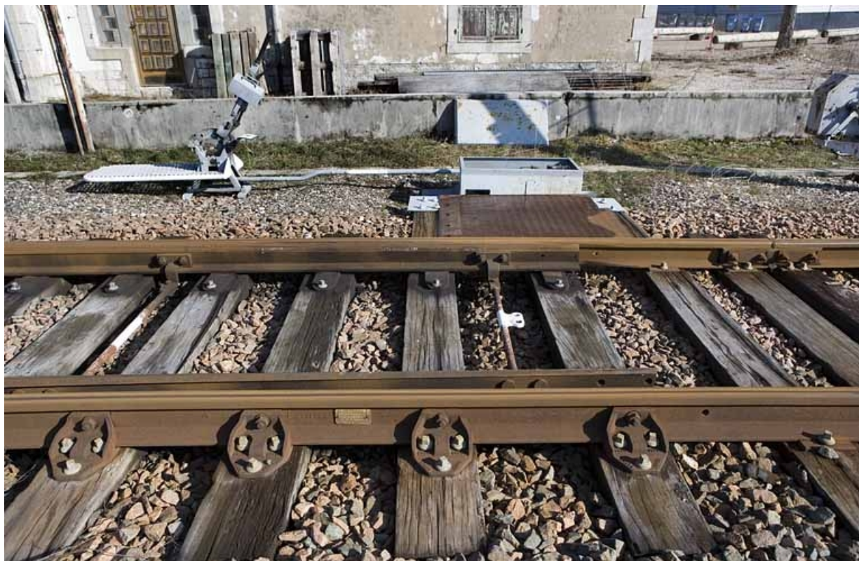
Levier de manoeuvre, système de renvoi d'angle et aiguilles.