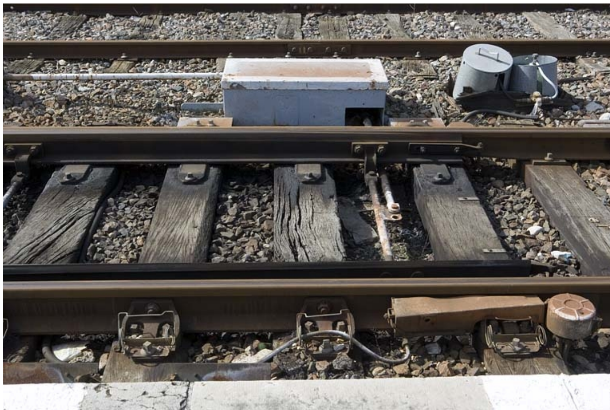
Exemple de rampe de réchauffage au gaz, sur un autre appareil (rampe partiellement démontée). Système de renvoi d'angle et bouteilles de gaz à l'arrière-plan.