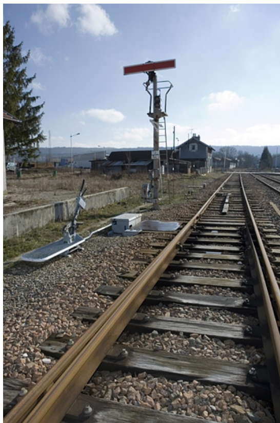
Vue d'ensemble, depuis le côté Andelot-en-Montagne.