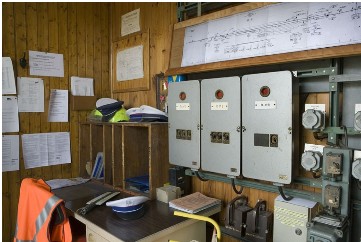
Bureau : vue d'ensemble.