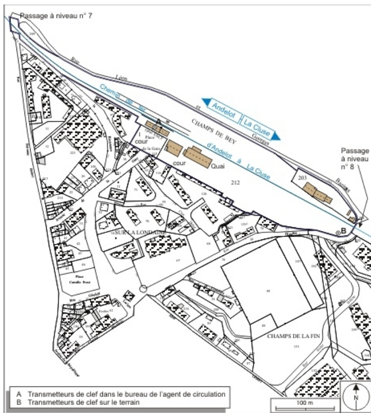
Plan de situation. Extrait du plan cadastral informatisé, 2006, section AE, échelle 1:3500. 39, Champagnole, 13 avenue de la Gare