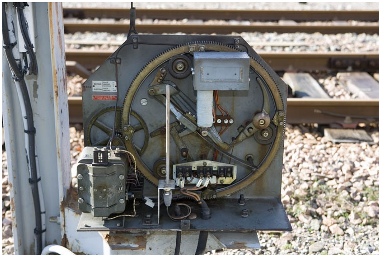
Vue rapprochée. Sémaphore côté La Cluse. 39, Champagnole, 13 avenue de la Gare