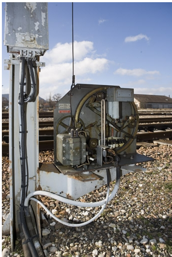
Vue d'ensemble. Sémaphore côté La Cluse.