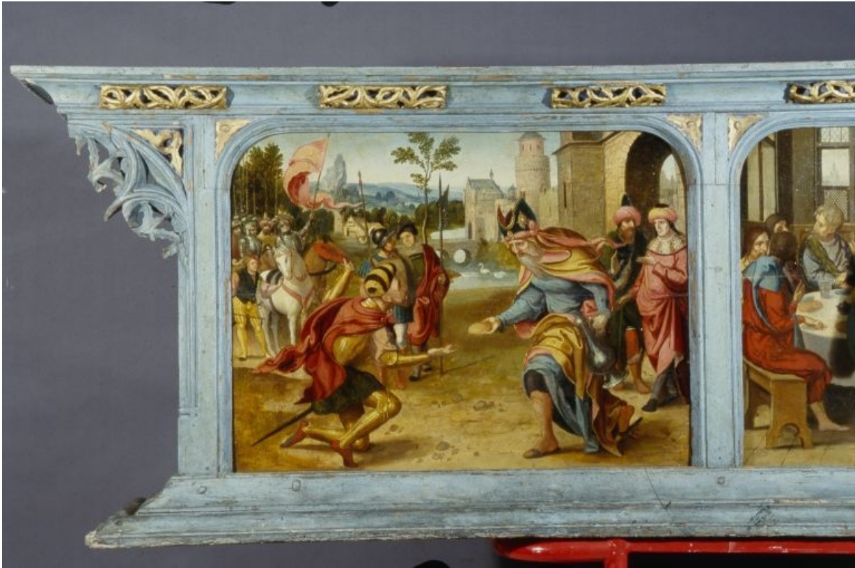
Panneau gauche de la prédelle : la rencontre d'Abraham et de Melchisedech (après restauration). 39, Baume-les-Messieurs