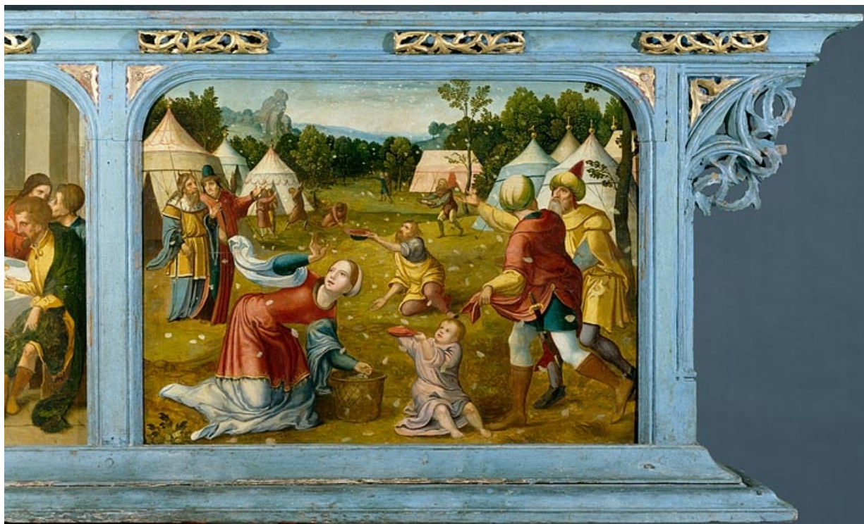
Panneau gauche de la prédelle : les Hébreux recueillant la manne dans le désert (après restauration). 39, Baume-les-Messieurs