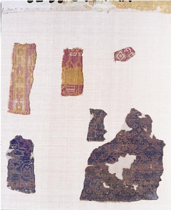
Morceaux de samit façonné soie et morceau de samit façonné soie, Egypte? 6e ou 7e siècle. Inv. Vial 83.7, 83.6. 39, Baume-les-Messieurs