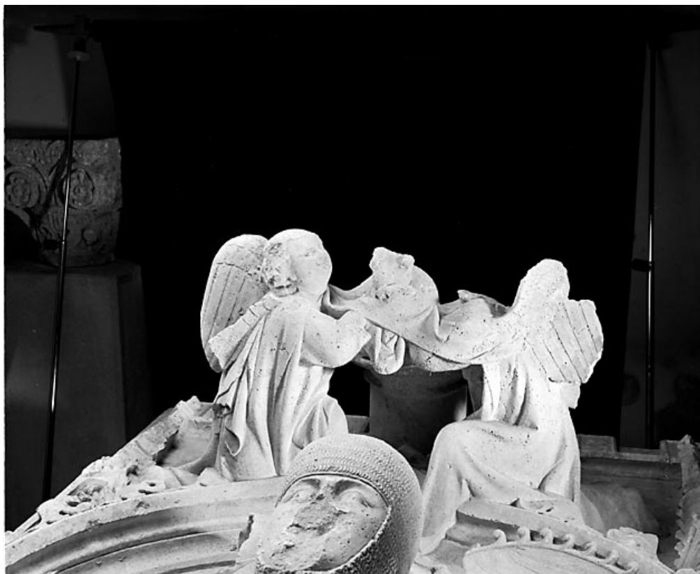
Détail : les anges à la tête de Renaud de Bourgogne.