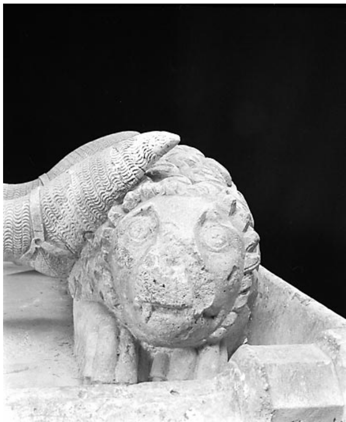
Détail : la tête du lion aux pieds de Renaud de Bourgogne. 39, Baume-les-Messieurs