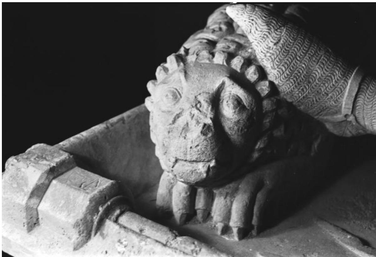
Détail : lion aux pieds du gisant.