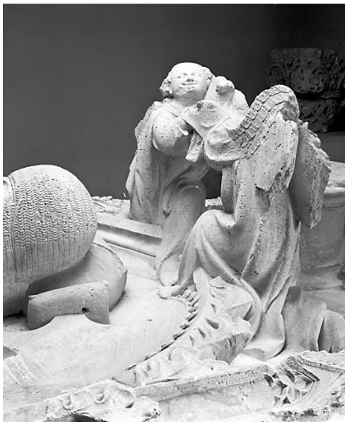
Détail : les anges, à la tête de Renaud de Bourgogne, vus de trois quarts. 39, Baume-les-Messieurs