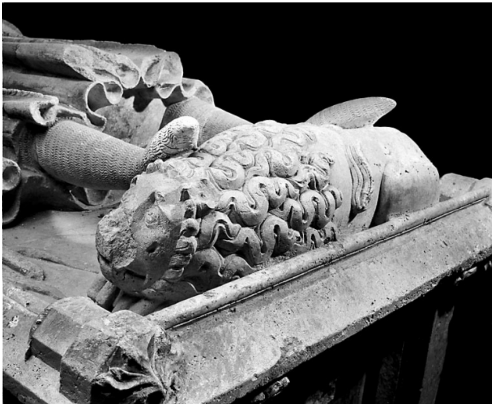
Détail : le lion aux pieds de Renaud de Bourgogne, vu de trois quarts gauche. 39, Baume-les-Messieurs