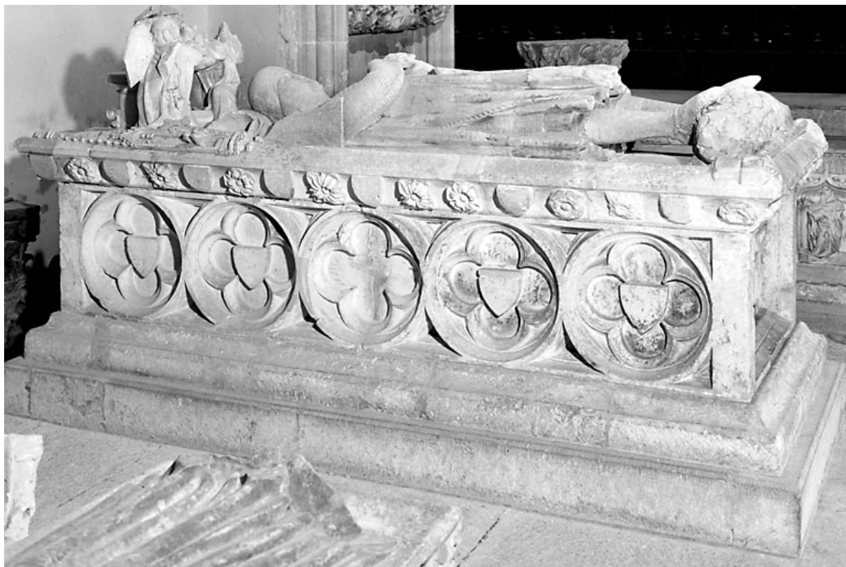
Vue générale de trois quarts.