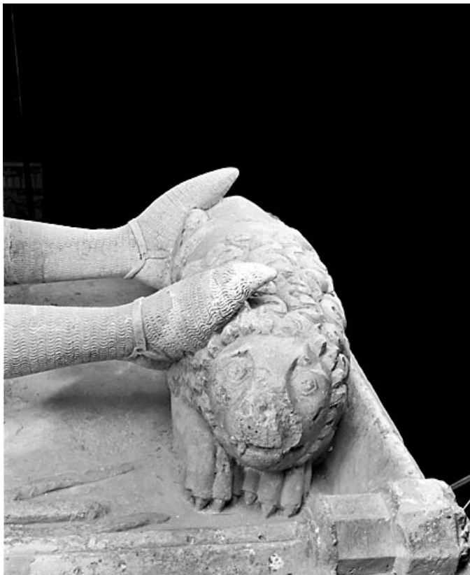
Détail : le lion aux pieds de Renaud de Bourgogne. 39, Baume-les-Messieurs