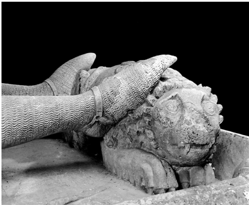
Détail : le lion aux pieds de Renaud de Bourgogne, vu de trois quarts droit. 39, Baume-les-Messieurs