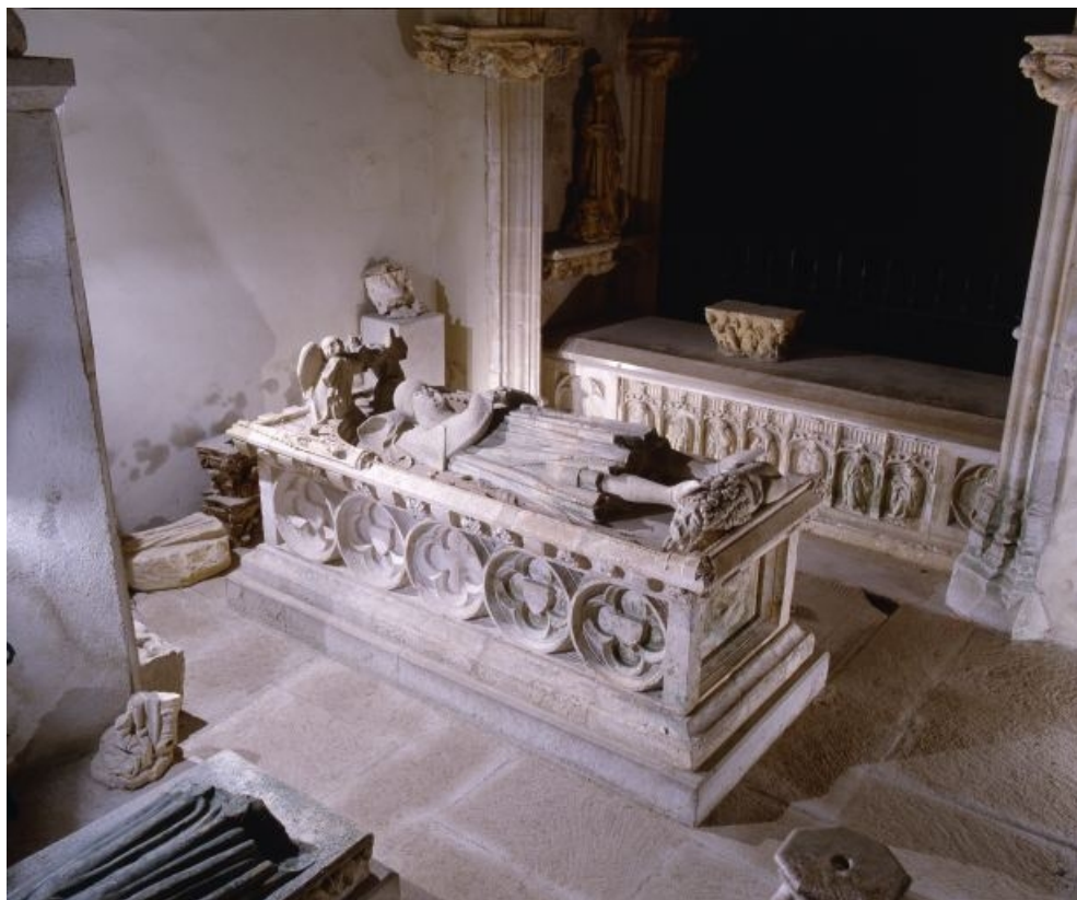
Vue générale de trois quarts.