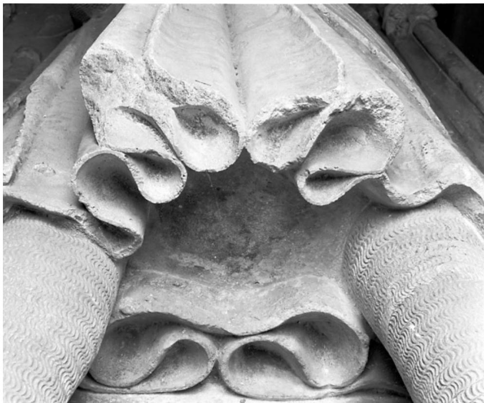
Détail : partie inférieure de la robe de Renaud de Bourgogne. 39, Baume-les-Messieurs