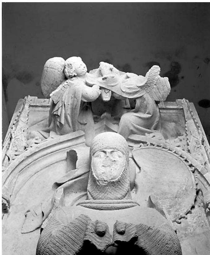
Détail : le buste de Renaud de Bourgogne.