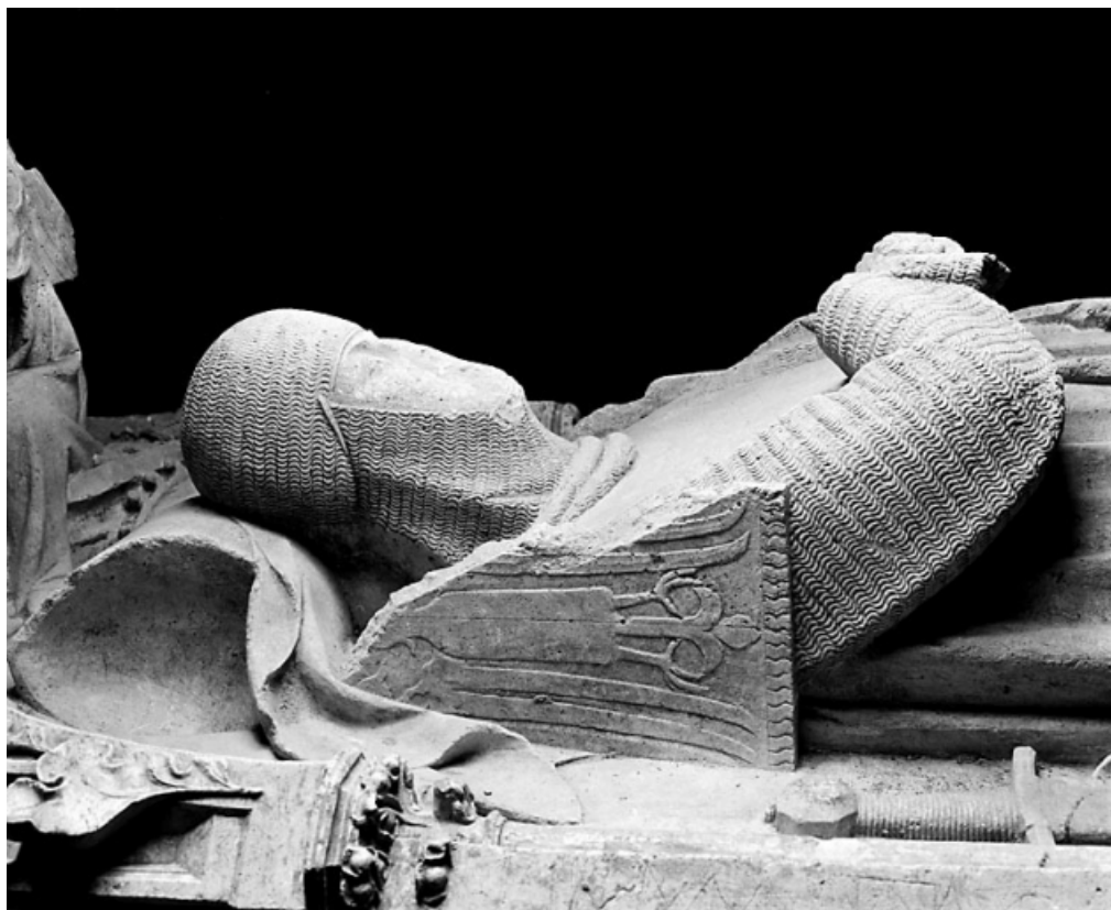
Détail : buste de Renaud de Bourgogne, profil droit. 39, Baume-les-Messieurs