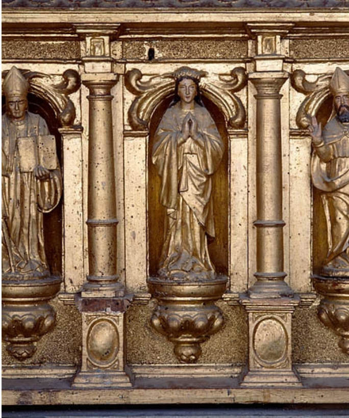
Sainte Cécile (?).