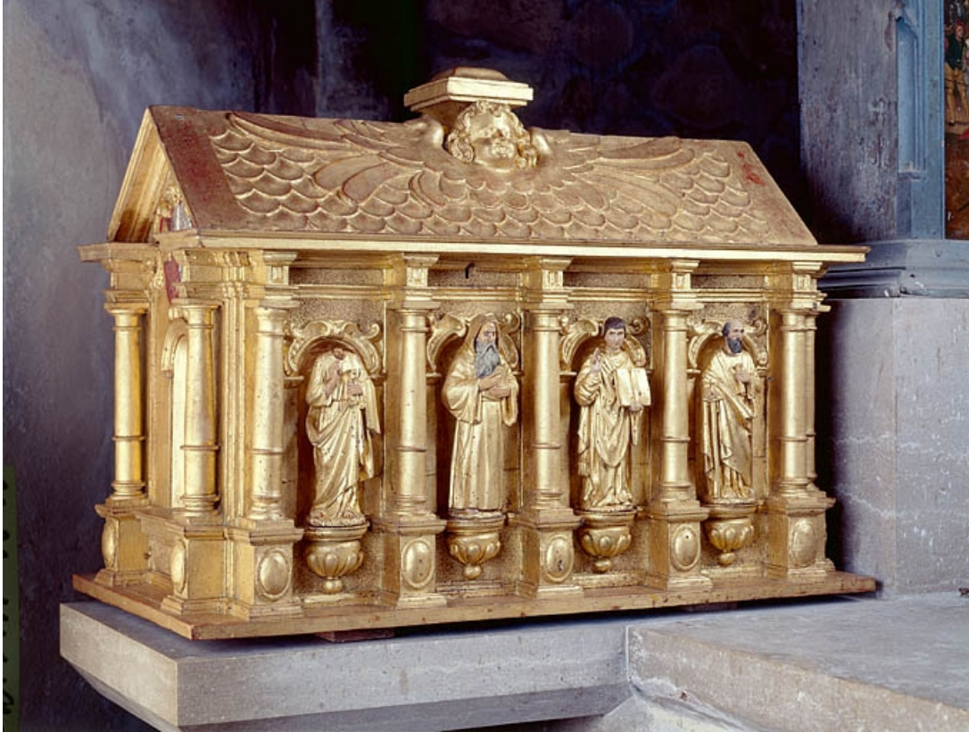
Châsse de gauche, vue d'ensemble de trois quarts.