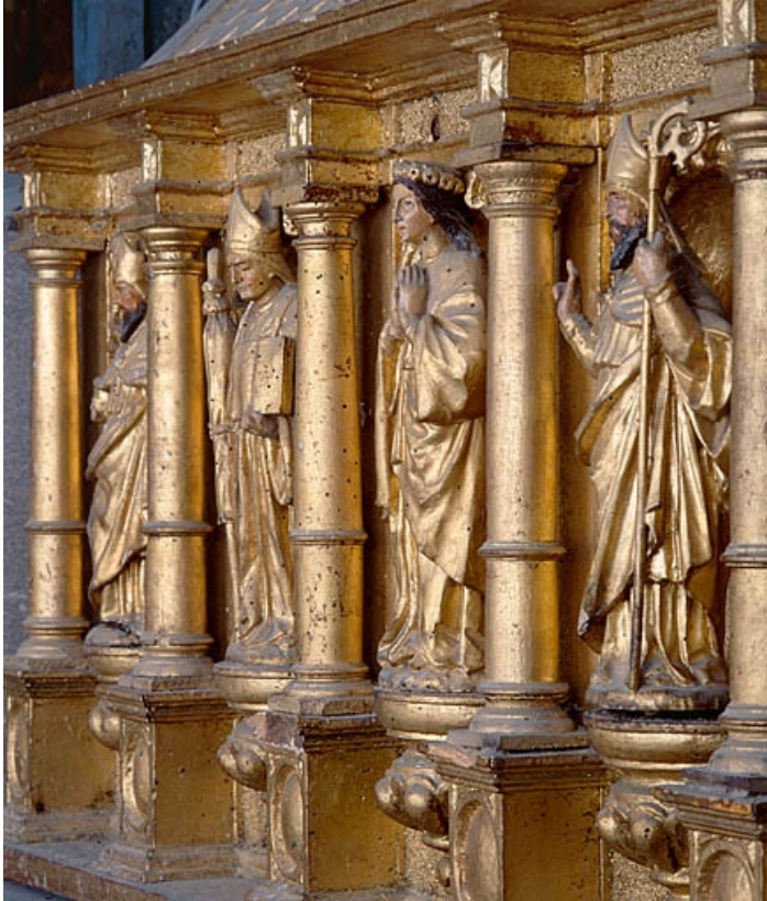
Châsse de droite, face antérieure de trois quarts.