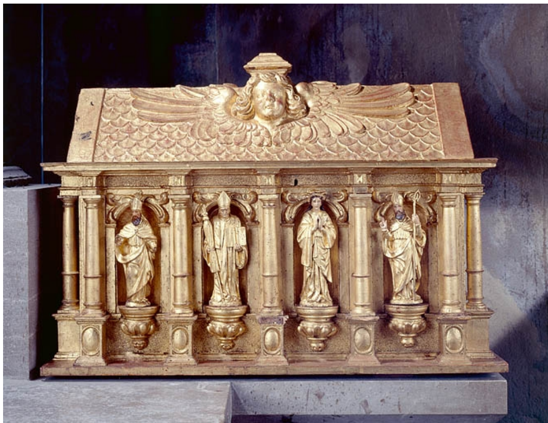
Châsse de droite, vue d'ensemble de face.