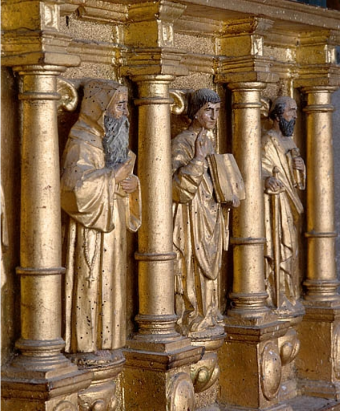
Châsse de gauche, face antérieure de trois quarts.