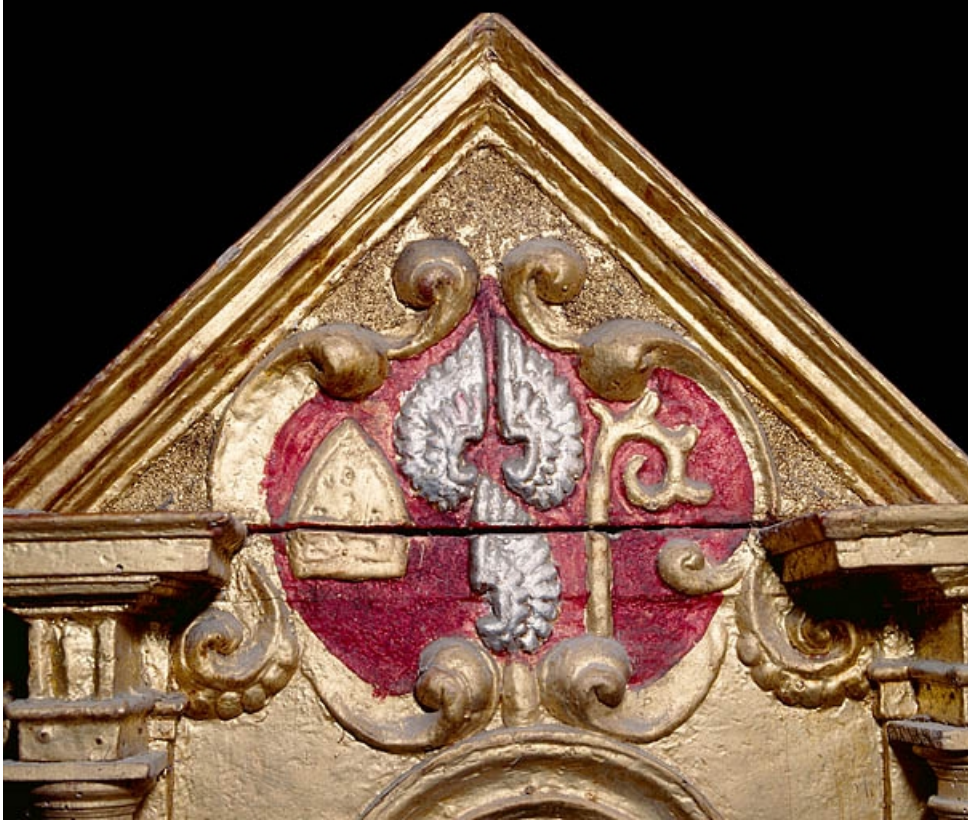
Châsse de droite, armoiries de Jean de Watteville.