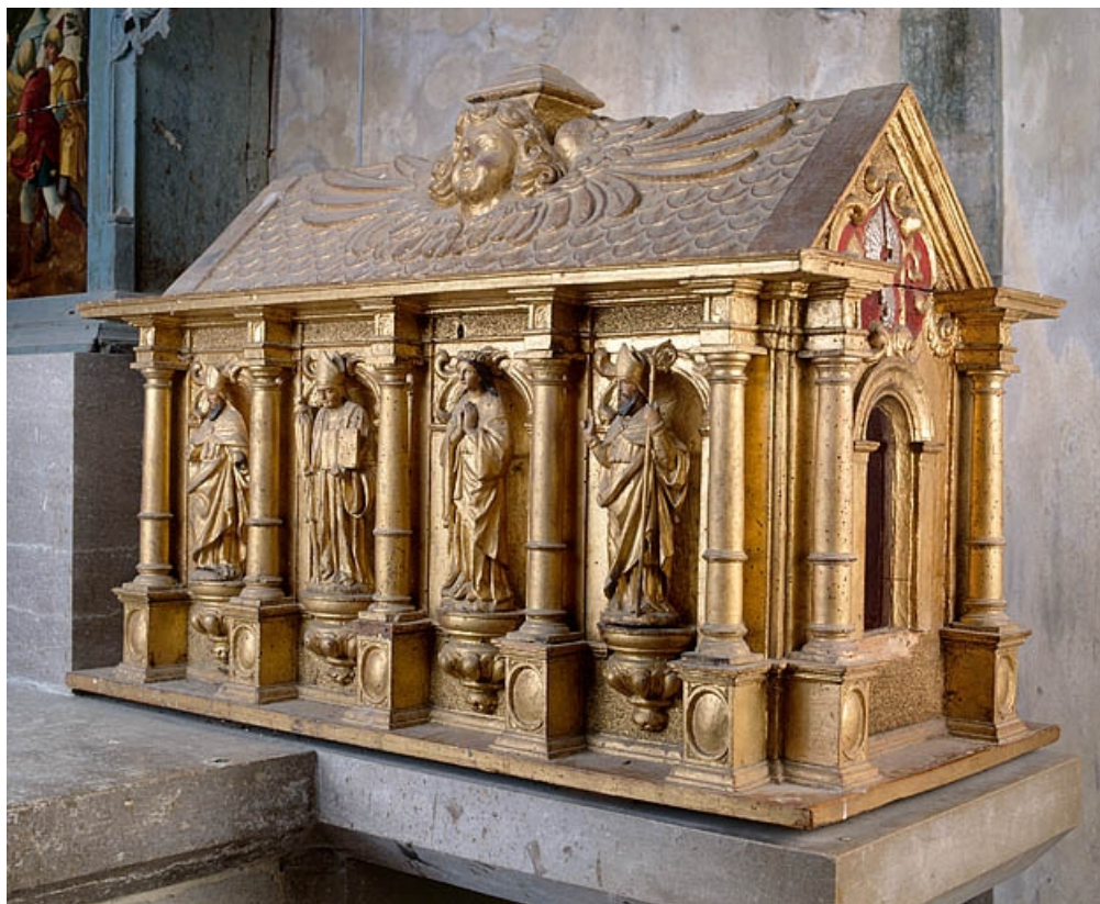
Châsse de droite, vue d'ensemble de trois quarts.