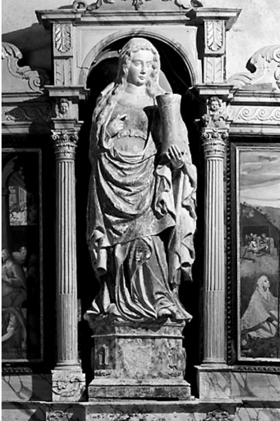
Sainte Marie Madeleine, vue de face.