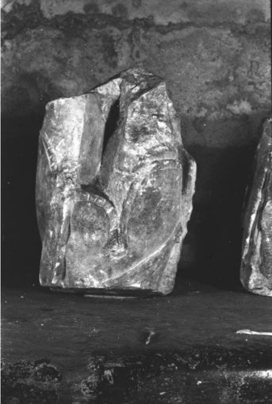
Vue d'un fragment.