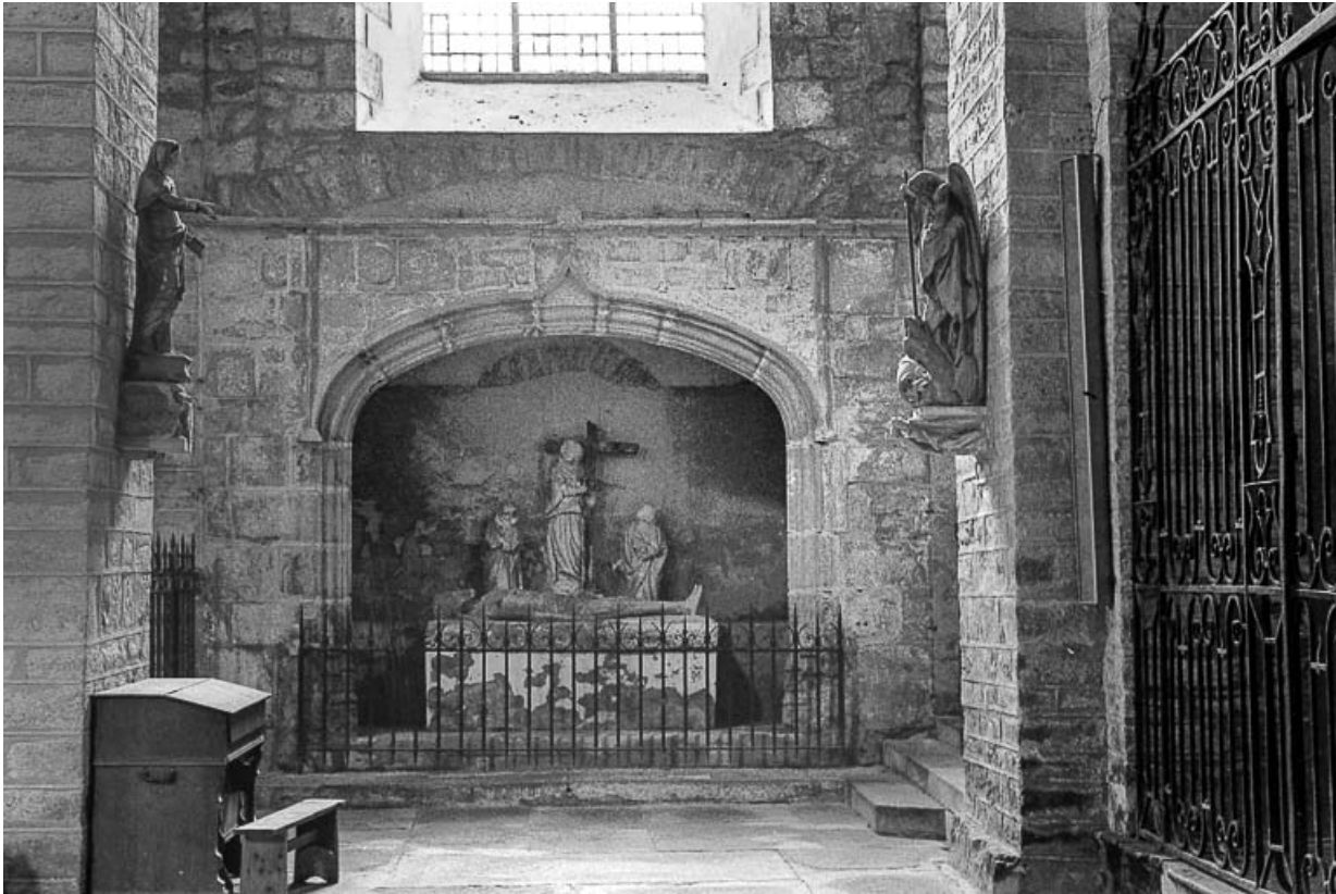
Groupe sculpté dans son enfeu.