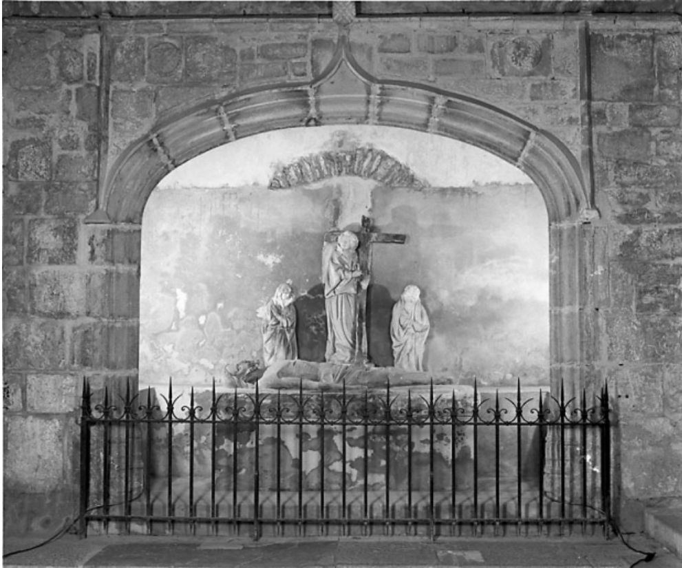
Groupe sculpté dans son enfeu.