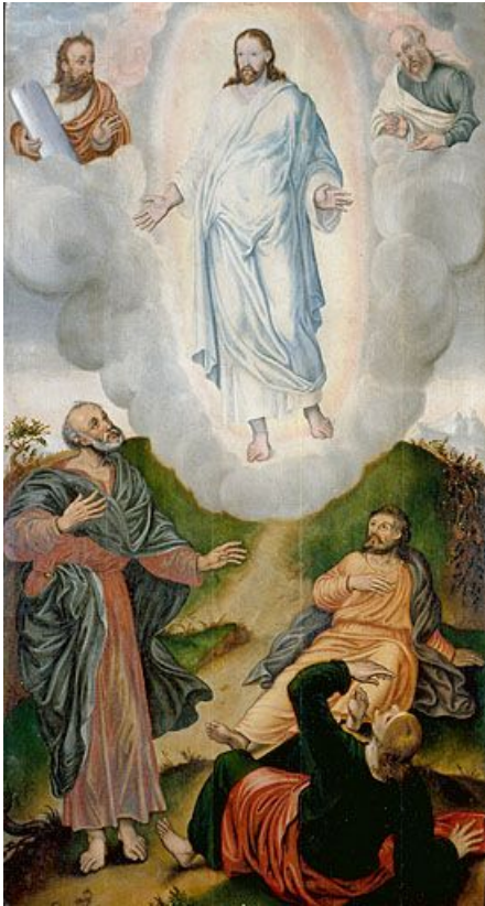
Panneau 4 recto : la Transfiguration.