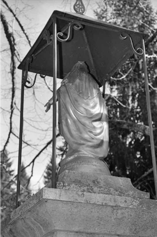
Vue du revers de la statue.

39, Longchaumois, lieudit : Bourbouillon