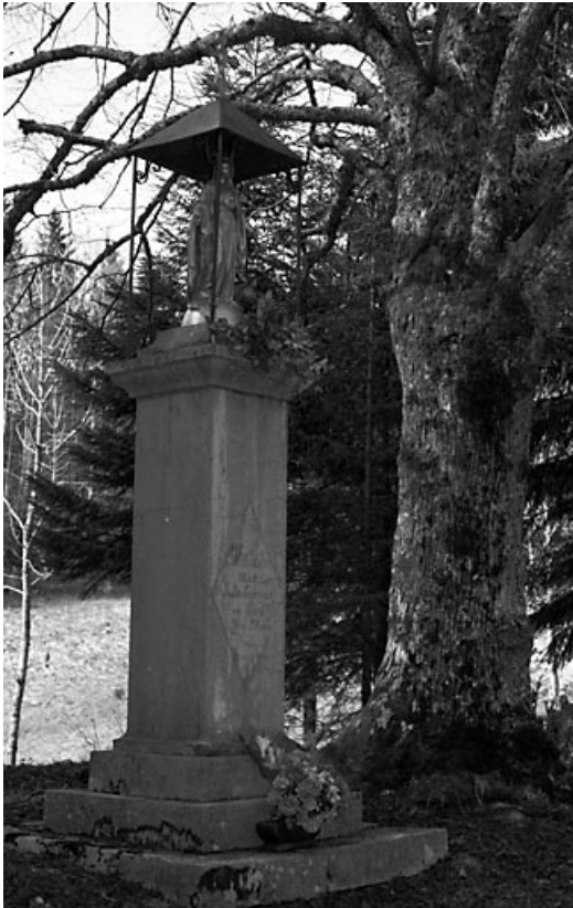
Vue générale de trois quarts.

39, Longchaumois, lieudit : Bourbouillon