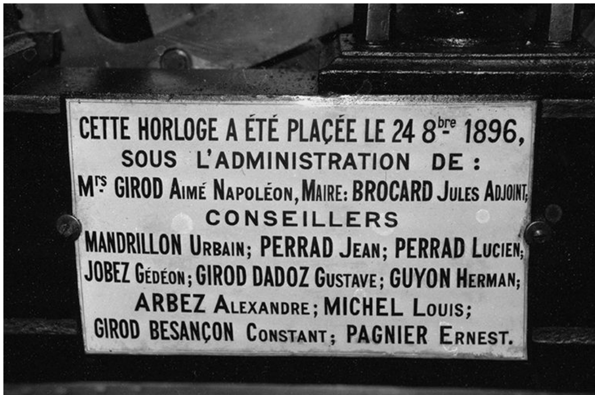
Plaque émaillée donnant la date d'installation et le nom des commanditaires.