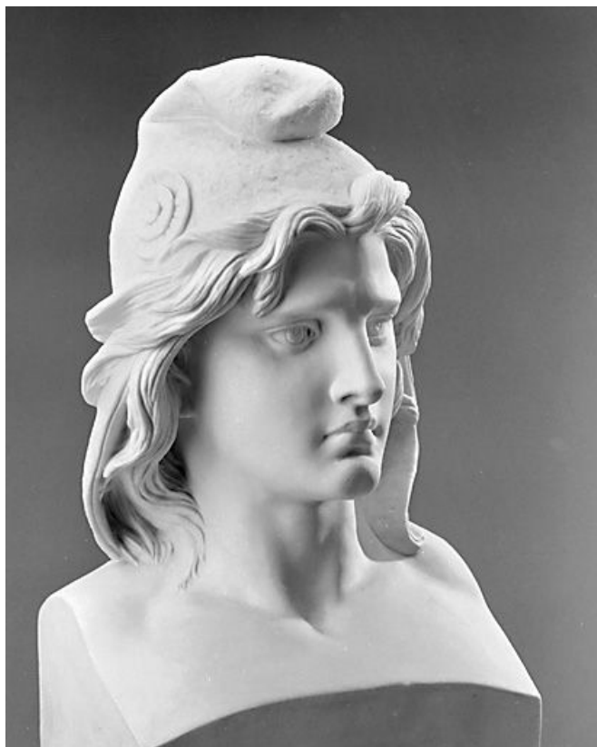
Vue rapprochée de trois quarts.