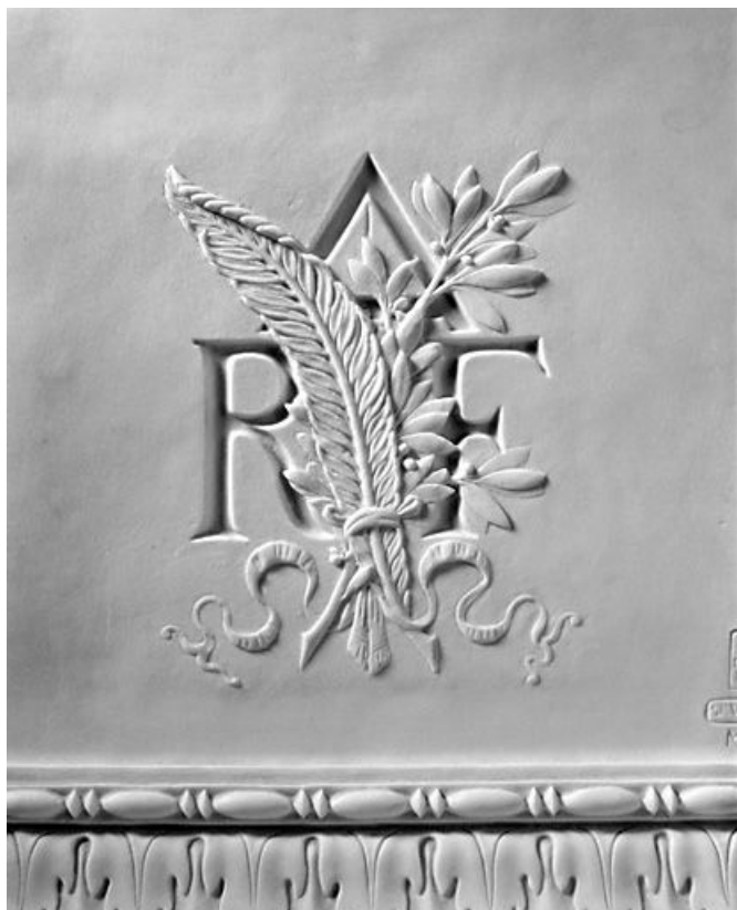
Détail du décor à l'arrière du socle.