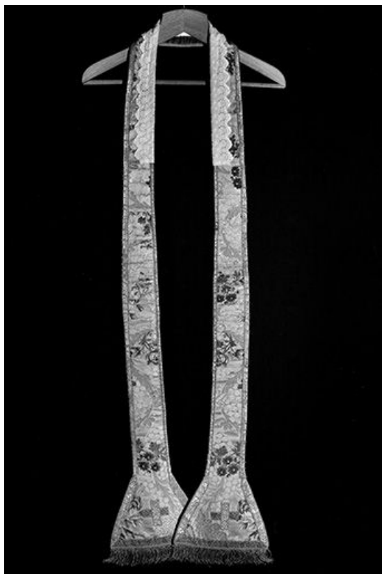
Vue de l'étole.