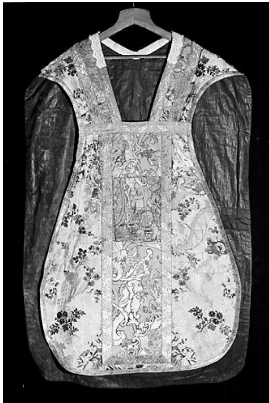
Vue générale de l'avant de la chasuble.