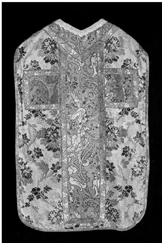
Vue générale du dos de la chasuble.