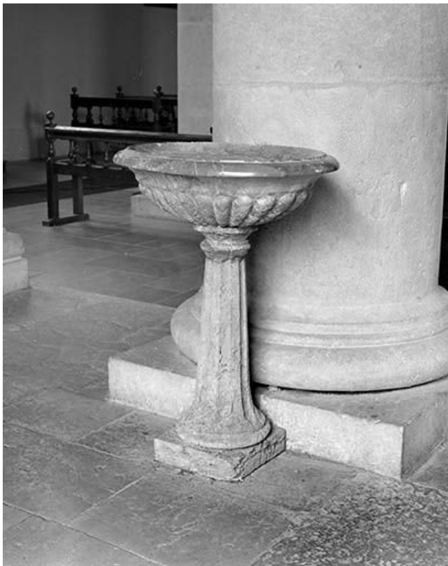
Vue générale d'un bénitier, de face.