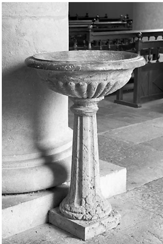
Vue générale d'un bénitier, de trois quarts.