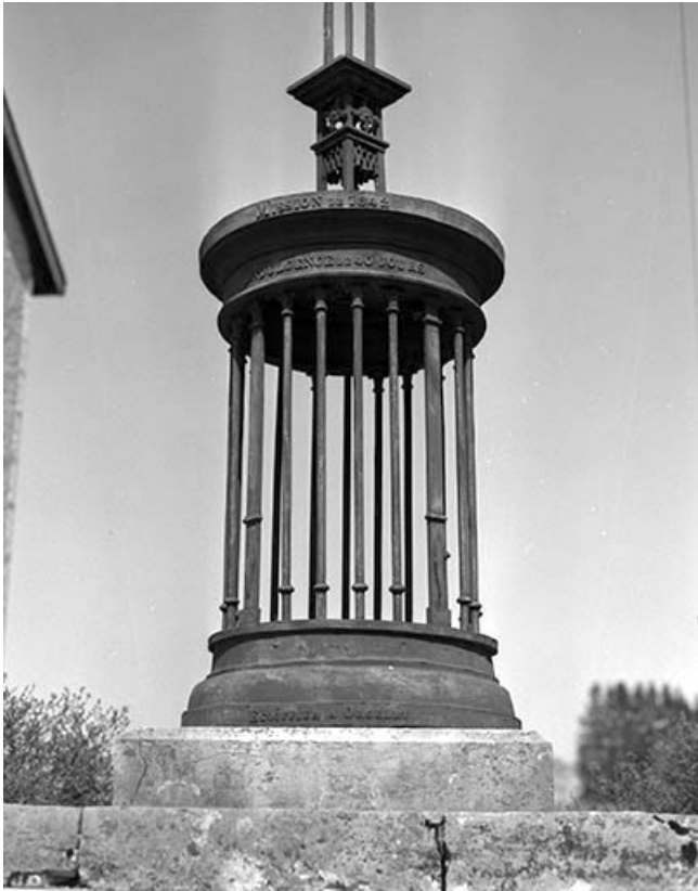
Détail de la partie inférieure.