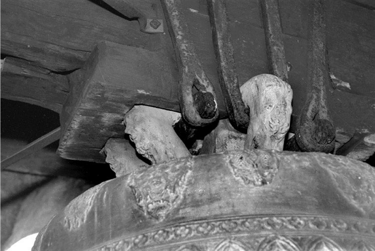
Anses (côté sud-ouest).