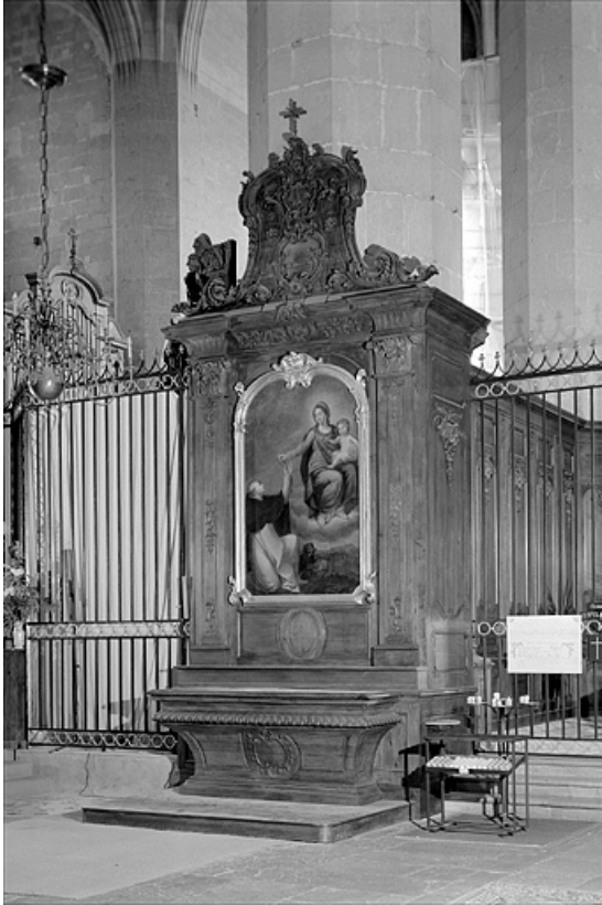
Vue générale de l'autel latéral sud.