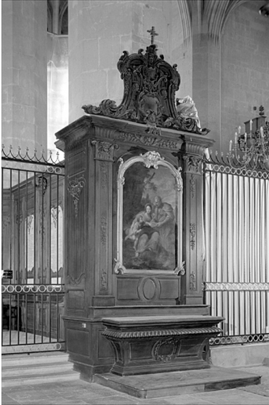
Vue générale de l'autel latéral nord.