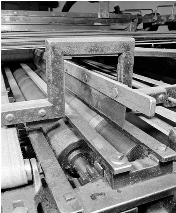
Détail d'un étage de pliage. La feuille est pliée lorsque le bras horizontal (au centre) la fait passer entre les deux rouleaux. 39, Saint-Claude, 12 rue de la Poyat