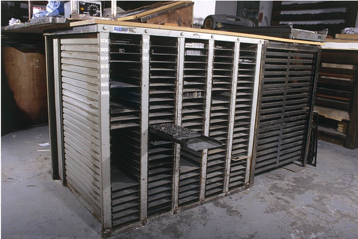
Deuxième meuble à galées, de trois quarts gauche. Une composition est placée sur la galée à demi tirée.