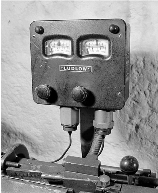
Boîtier des instruments de mesure Ludlow.