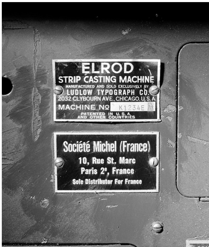
Plaques du constructeur et du revendeur.